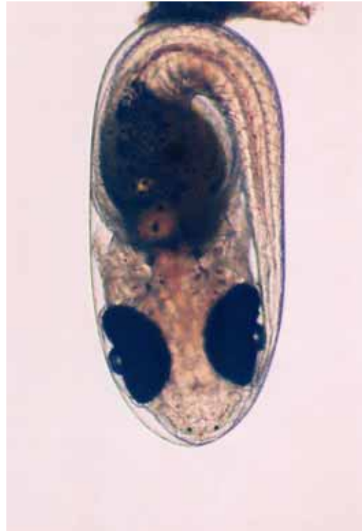
公子小丑胚胎-孵化前