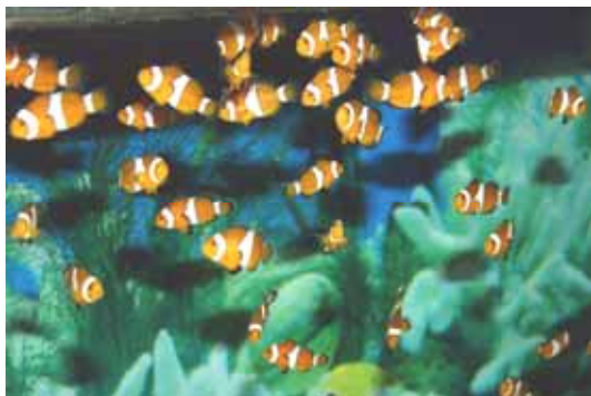
公子小丑 100 日齡