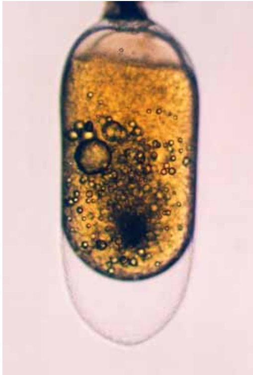
公子小丑受經卵 2-細胞期