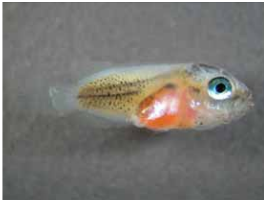
公子小丑 7 日齡