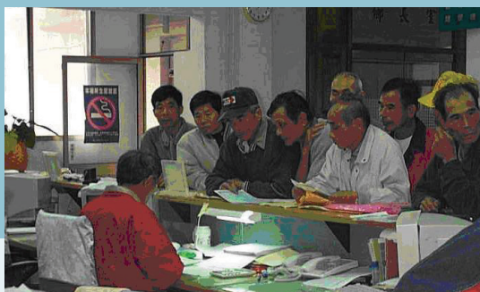
現場受理救助申請情形。

合計受理申請「農業天然災害現金救助」的總戶數共23萬5,478戶，經勘查合格核撥的受災農漁民共20萬2,606戶，核發救助款53億3,660萬元，減輕農漁民遭受天然災害損失負擔，協助恢復正常的農業生產，安定農漁民生活，穩定農村社會。