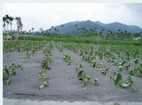
台東縣農田埋沒情景。