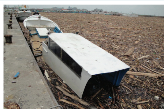
屏東地區漁船遭漂流木撞擊沉沒。

另依據「台灣地區遭難漁船筏救助要點」，在海上作業的漁船因風災而全毀或半毀者，也可向漁業署申請救助，計有一艘符合資格，救助金額為1萬元。