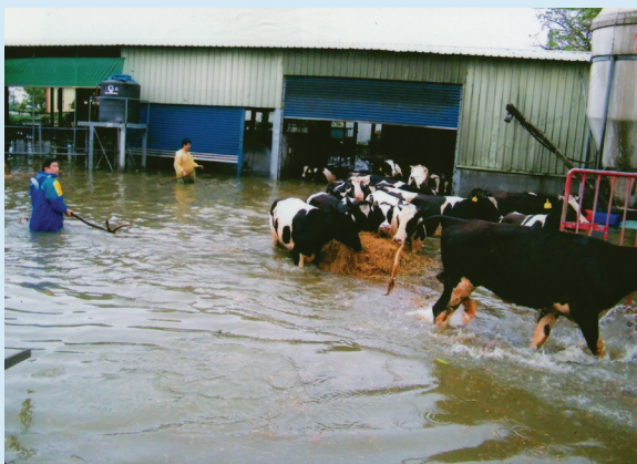
酪農引導牛隻涉水撤離。

類似的互助故事，在一座座受災牧場裡上演著。災後第一時間的酪農受災戶，必須一面清理家園，一面照顧生病的乳牛，若非互相扶持、彼此幫助，根本無法撐過那段人仰馬翻的時光；也正是在這樣的情義相挺中，人性的光明與良善展露無遺，如同鮮乳般滋潤人心，化成度過難關的養分。