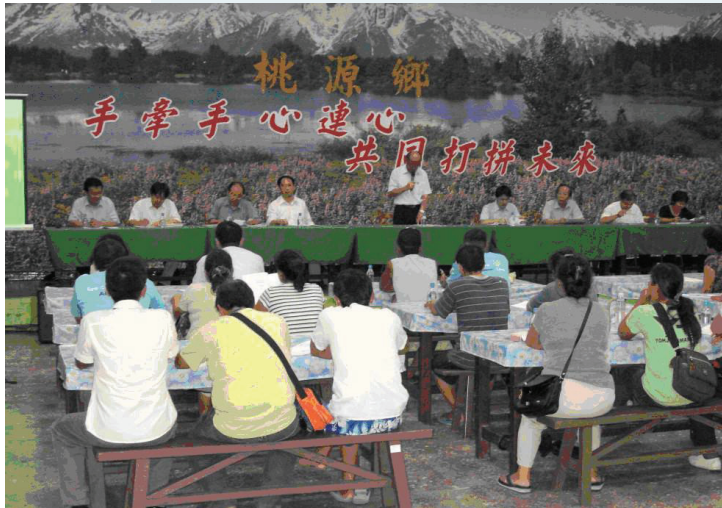
高雄縣桃源鄉農業重建說明會辦理情形。

台灣受地理環境影響，天然災害頻仍，致農業生產容易受損，農委會依「農業發展條例」第60條第2項規定，訂定農業天然災害救助辦法，辦理災害救助，以照顧農漁民，減輕其災損負擔，協助農漁民災後盡速復耕、復建，早日恢復生產，繼續經營農業。當發生重大天然災害且各縣市政府農業災損查報情形達救助門檻時，農委會即依照上開辦法規定，立即公告救助地區、農產品項目、救助額度，以辦理救助措施，救助項目包括農作物、漁業、林業、畜牧等四大項。