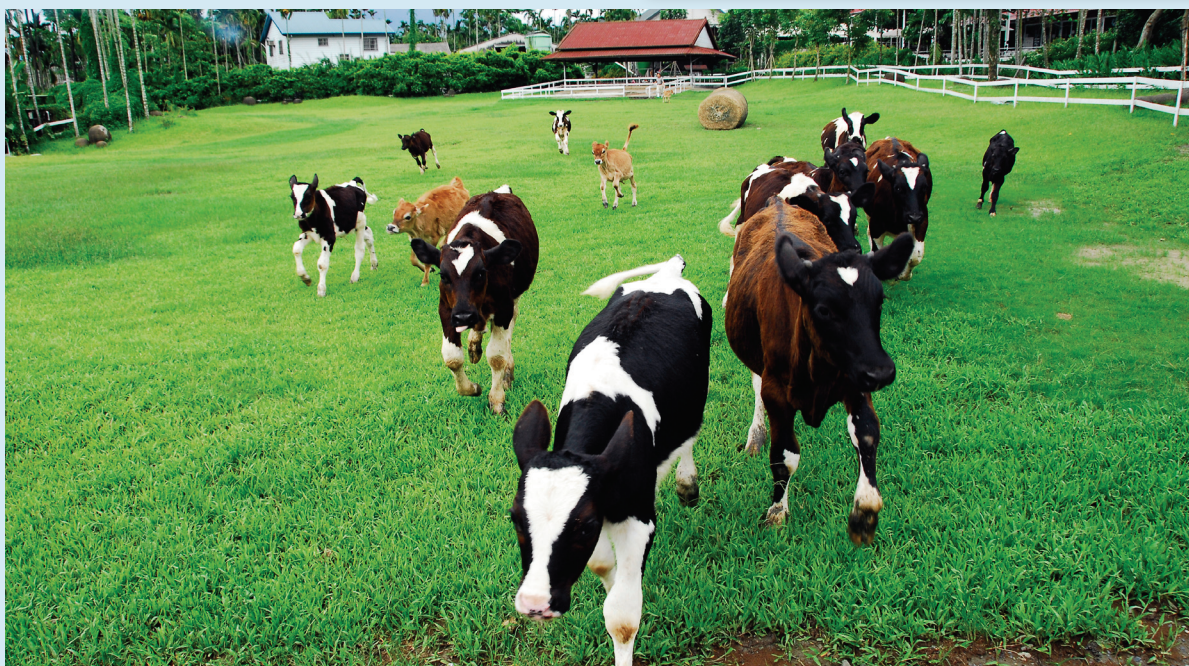
酪農秉持台灣牛的精神，挺過風災重新出發。

基金規模：截至2009年底，牛乳產業服務費用實際收入及利息計新台幣一千九百九十三萬餘元，加上畜產會核撥獎勵金新台幣二百九十萬餘元，總計約新台幣二千二百八十三萬餘元。