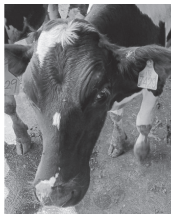
牛隻需注意是否罹患牛結核病。

布氏桿菌症是由布氏桿菌 (主要是 Brucella abortus 、 B. melitensis 及 B. suis ) 感染所引起之傳染病，主要感染牛、羊及豬。動物感染後會有生殖器官發炎、流產及不孕等症狀。