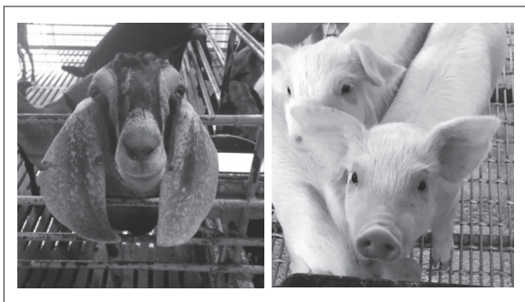
接觸羊豬有感染布氏桿菌症的風險。

RG3病原大多是可藉空氣傳播給人類，所以研究人員進行實驗時需要有一個設備或箱子，將空氣不斷抽走，形成空氣流動，將實驗中飄起或懸浮的病原隨氣流帶走，並經由過濾膜篩除病原，以避免研究人員吸入而感