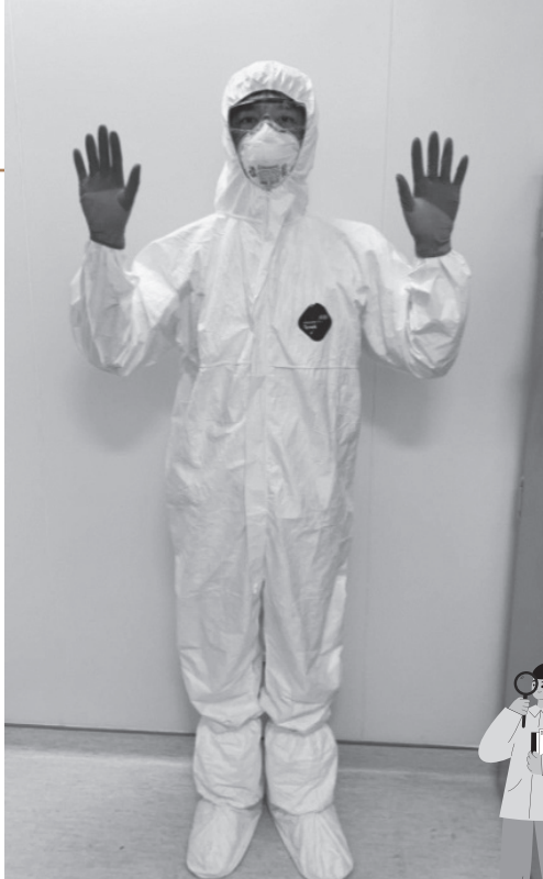
個人防護裝備是最後一道防線。