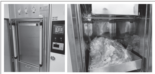
以高溫高壓進行滅菌。

染，生物安全櫃就是依照這個概念所設計的箱子。在生物安全櫃中，利用排風機將空氣持續排出形成氣流，並將排出的氣體通過高效能空氣濾網（High Efficiency Particulate Air Filter, HEPA），阻擋絕大部分病原後，排出乾淨的空氣。因此當有任何可能造成病原飄起或懸浮的動作，就應該在生物安全櫃中進行，以確保工作人員健康。