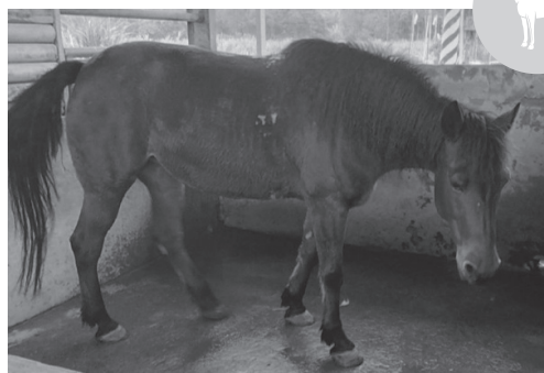
馬匹有可能攜帶炭疽桿菌。