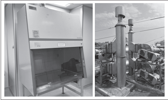
生物安全櫃保障實驗室安全。