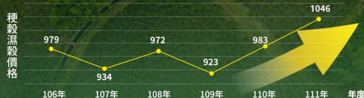
全國歷年106-111年新期濕穀價格(單位:元/每百臺斤)

濕穀產地價格111年超過 1,000元/百臺斤 降低公糧收購依賴 提高農民收益 近年最高！