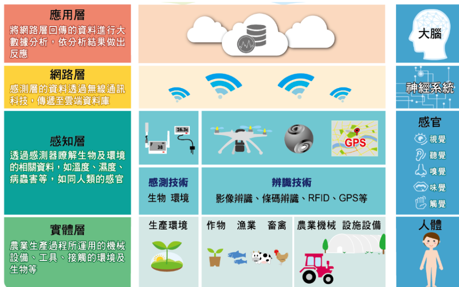
圖 2、農業物聯網技術應用階層圖