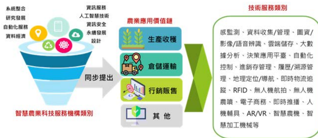
圖 1、技服機構核心技術應用於農業領域之關係圖