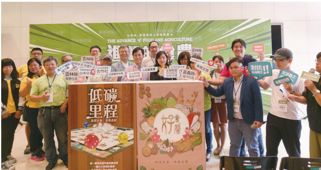
桌遊出版暨聯名推廣記者會貴賓合影。

臺灣因地理位置分布，而有著多變的地形、天候、生態等自然條件，隨著歷史脈絡、人口發展與多元文化的融合，更有著豐富多元的農作生產、生態資源、人文飲食以及消費模式，而今現代化的生活分工精細，人們與自然環境的關係逐漸脫離、顯得陌生，加上前些日子塑化劑、芬普尼雞蛋等食品添加物問題層出不窮，以及農產品檢測出過量農藥、抗生素等事件的一再發生，形成近年來農業與食品安全風波不斷，消費者們憂心食品安全與食材來源，使得關心食物議題與飲食教育的意識逐漸抬頭，然而矛盾的是，民眾大多缺乏選擇食物的能力，也無暇瞭解餐桌上各式各樣的食物來自何方，以致生產者與消費者、農村與都市的差異逐漸拉大，社會大眾及孩童對農村及農業逐漸失去認同感。因此，為讓民眾重新建立正確的消費與飲食知識，強化連結產銷二端互助合作關係，縮短城鄉差距，擴大、深化並以創新的形式性推動食農教育有其必要性。