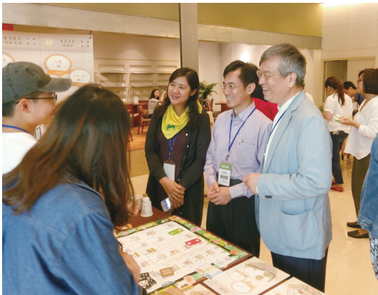
桌遊出版暨聯名推廣記者會會後討論熱烈。

未來，在地方創生政策的方向下，食農教育的推動是促進農業競爭發展、體現農村文化價值、傳承農業文化根本以及奠定正確飲食觀念之重要一環，在深化發展農村在地產業、人文與特色的同時，找到人與自然共存共榮的生活智慧與文化，同時以跨領域結合各領域專業知識與技術，促進民間團體、企業與農村建立實質合作，透過協力合作發揮農村地方特色，吸引多元化產業進駐及參與，創造在地經濟與就業機會，促進縮短城鄉差距、區域均衡適性發展，以達到「地方創生，農村再生」之願景目標。