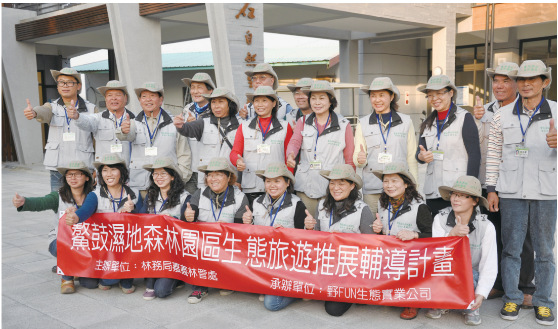
圖 4. 鰲鼓濕地森林園區社區解說員授證。

林務局從 101 年起，以『鰲鼓濕地森林園區生態旅遊推展輔導計畫』展開長達 3 年的輔導陪伴輔導社區發展生態旅遊產業。經 2 年的輔導陪力，