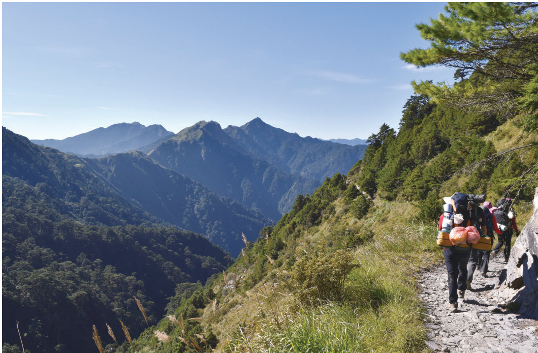
圖 1. 能高越嶺國家步道為橫貫越嶺古道中相當熱門的路線。

能高越嶺道西起霧社，沿著塔羅溪上行、越過南投縣與花蓮縣交界的中央山脈能高鞍部，而後下木瓜溪抵達花蓮，全長約 83 公里，是早期往來臺灣東西部的捷徑，為日人警備道中最寬闊、平穩的一條。如今除部分公路化路段外，林務局整建其中屯原至五甲崩山間 27 公里之路段為國家步道，沿線可見標高 3,262 公尺的能高山，為橫貫越嶺古道中相當熱門及大眾化的一條路線，沿線仁愛鄉春陽村、精英村及都達村等，為賽德克族重要部落。