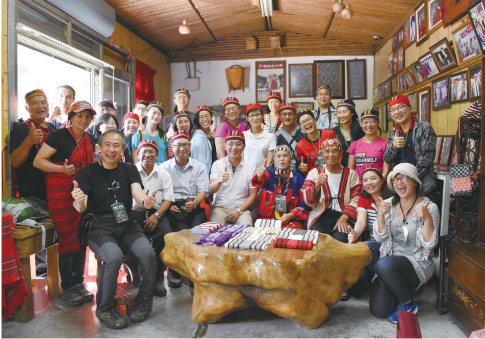
圖 3. 能高生態旅遊之部落傳統編織體驗。

第二年期：專業團隊持續輔導培力，深化遊程並提升參與人員之相關知能，協助夥伴部落籌組成立正式人民團體（南投縣能高越嶺道生態旅遊推動發展協會），作為跨部落自主經營組織，以建立單一窗口進行對外接團工作；自主經營組織並參與農村再生計畫，實質從事民族植物調查指認、生活記憶展示、手作步道知能培訓，部落農業安全用藥等工作，以做中學之模式培養組織能量，並提升生態旅遊遊程之多元化及在地化。