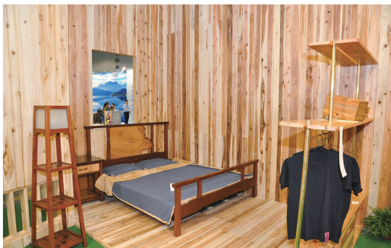
國產材臺灣館展區內部場景 營造居家環境。

經過多次密集討論，打破一般商展個別展售商品的形式，以「團體戰」出擊，集結國內 14 家使用國產木竹材的民間業者協作，包括臺大實驗林管理處木材利用實習工廠以令人驚豔的柳杉拼接 CLT 牆面、旺亮木地板經特殊處理的相思木地板、昆儀實業現場酒木講座及熱改質樂器表演、昆晉實業帶來室外木格框和雨淋板、正昌製材提供原木裝修壁板、德豐木業以結構材展現了優雅的天花板設計、大藏聯合建築師事務所的竹構設計、竹籟文創的竹編造景及茶室、振茂木業帶來了極度吸睛的臺灣柚木桌等，各家廠商都拿出看家的產品強項，發揮各自的獨到之處，兼顧展品實用創新與整體裝潢感受，再搭配專業的解說，創造完整的體驗空間，果然不負眾望，在 550 個參展單位中，再度獲得本屆國際建材展「優良參展企業形象獎」的殊榮。