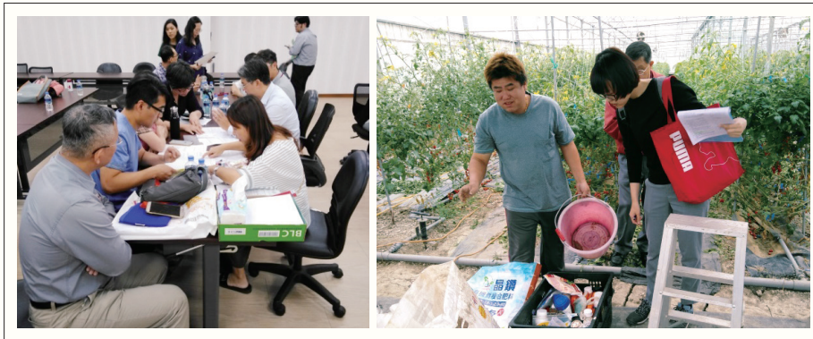
農委會辦理不預警見證查核及總部查核情形。