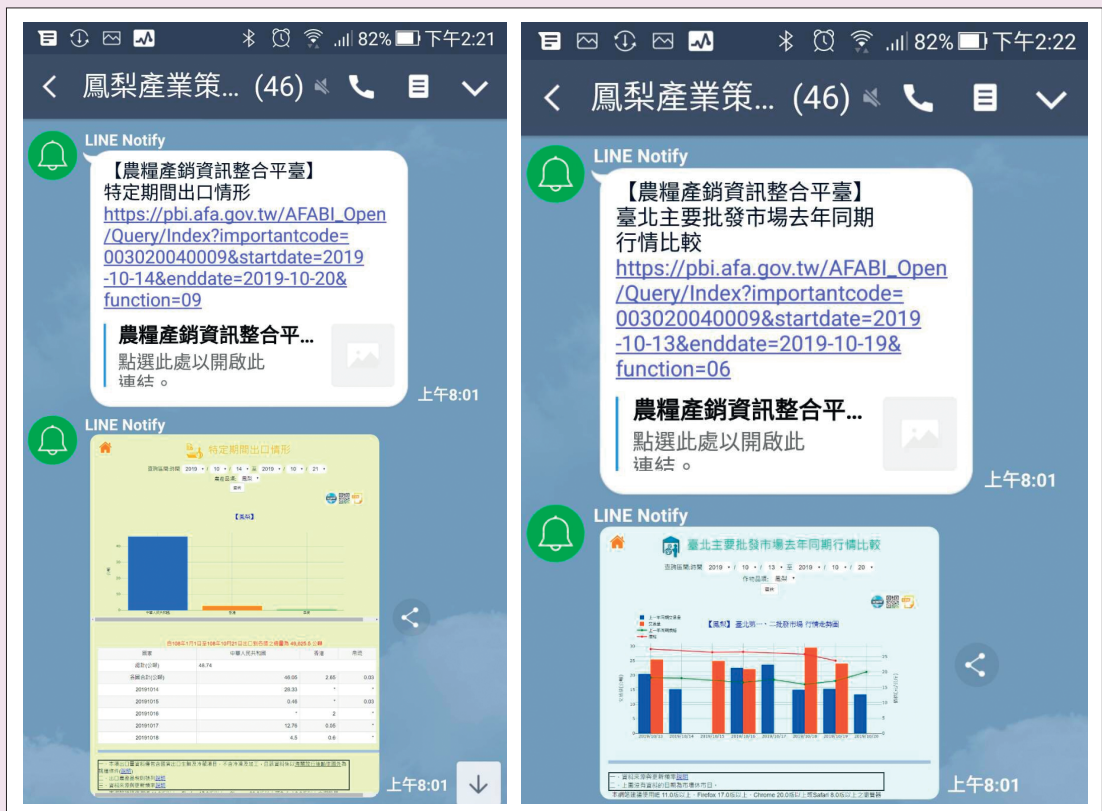
圖 4. 平臺主動傳遞產銷資訊圖表至策略聯盟群組。

本平臺提供之產銷資訊，可協助農政單位輔導農產品產銷作業與維持蔬果價格平穩，並做為產銷班、合作社/場、農會及農民等擬訂產銷策略之參考；亦可供政府單位綜合評估研判蔬果供給與市場需求狀況，進而採行適當調節措施。精進後之平臺力求資訊傳遞更多元廣泛，使農糧產銷業務推動更具靈活與彈性，未來將持續蒐集使用者反映意見，滾動式檢討精進功能與資料項目，提供更符合使用需求之資訊服務。