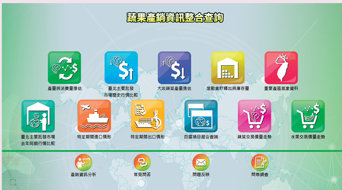
圖 1. 蔬果產銷資訊整合查詢網站（改版前）。

農糧署依據 105 年 10 月 27 日農產品產銷管控機制及菜價平穩檢討會議主席（行政院林全前院長）裁示，規劃資訊服務，並與行政院農業委員會農業試驗所、中央氣象局及國家防災中心研商氣象資料交接事宜，及洽財政部關務署提供每日進出口蔬果與雜糧資料交接，且與臺北市、臺中市及高雄市政府洽談取得公有零售市場資料。結合農糧署業務推動蒐集分析之蔬菜重要產區、生產預測、滾動倉貯及批發市場交易行情等資料，以實務應用分析為發展主軸。並經唐