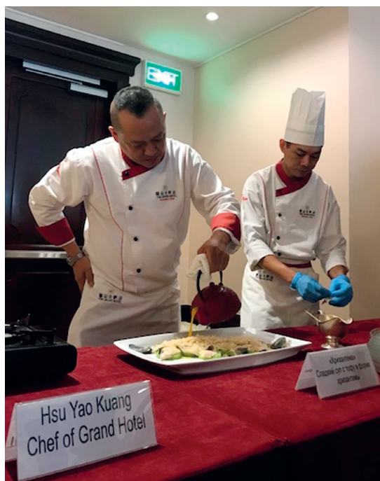
「臺灣農產品推廣會」許主廚現場表演臺灣蔬果入菜。