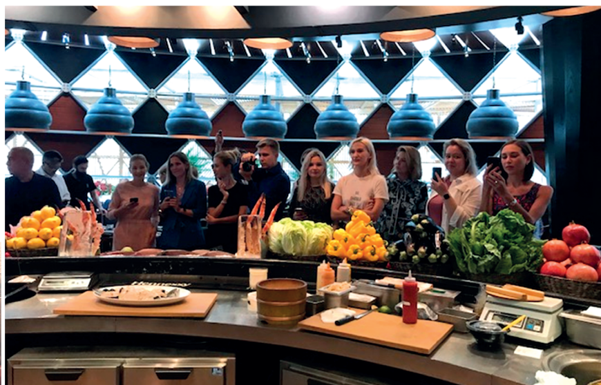
「臺灣美食記者會」出席之俄羅斯媒體記者。

8 月 22 日中午由圓山飯店主廚假 Novikov 集團旗下設於 Ritz Carlton Hotel 之 Novikov 餐廳舉辦「臺灣美食記者會」。查 Novikov 集團係俄羅斯最大高級餐飲集團，創立於 1991 年，集團總裁 Arkadiy Novikov 亦出席活動並表示，該集團在俄羅斯及杜拜、邁阿密、倫敦等地有逾 80 家不同類型的餐廳，主打高端客群，對多元食材需求極大，渠深信藉由此次活動可使該集團旗下餐廳開始構思將臺灣食材入菜以及推出泛亞洲菜色之