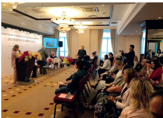
「臺灣農產品推廣會」現場與會賓客。

口現況、外銷策略及措施，另介紹臺灣參展廠商，活動現場以統一的臺灣形象佐以本次進口之花卉、水果、茶葉布置會場，邀集俄羅斯政府部門（國會議員、俄羅斯農業部）、