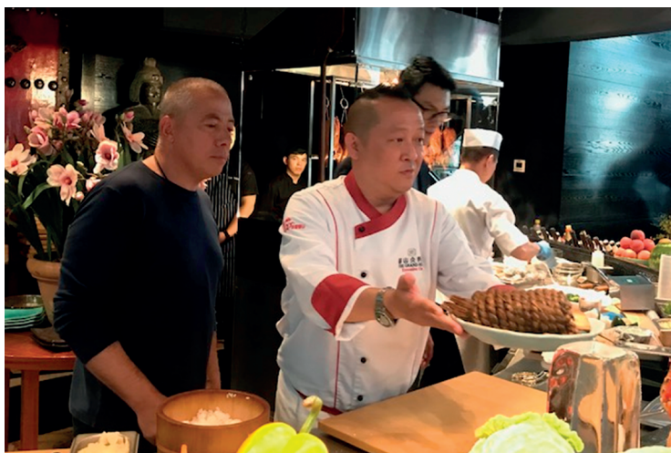
「臺灣美食記者會」許主廚現場表演臺灣蔬果入菜。

可行性。本次記者會該集團共邀集 15 家俄羅斯重要媒體記者，許主廚於現場以臺灣食材烹飪 7 道精緻佳餚，獲現場媒體記者一致讚賞，線上發表會觸及 51 萬觀看人次，活動效果極佳。