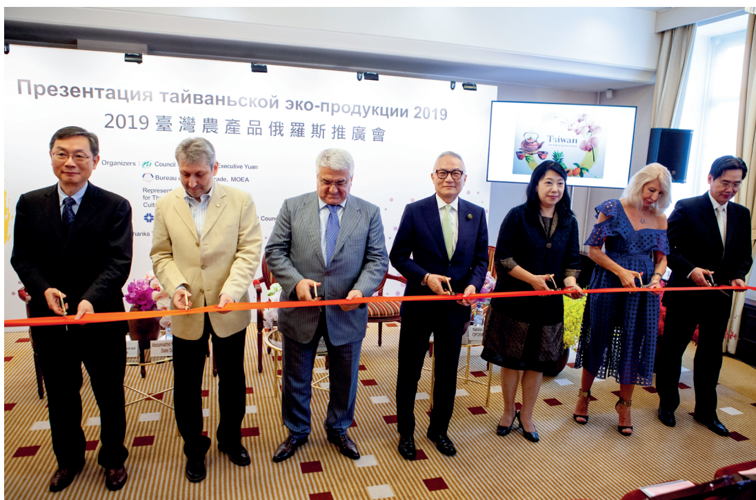
「臺灣農產品推廣會」開幕式剪綵。