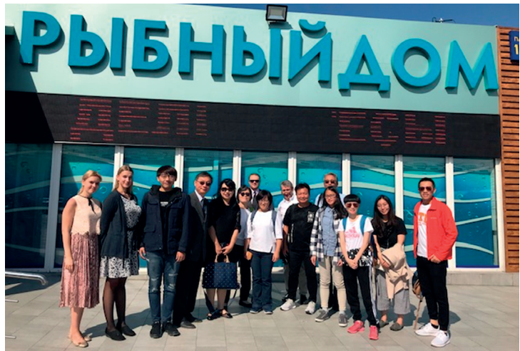
參訪 Food City。

推廣會於 2019 年 8 月 21～22 日假莫斯科 Marriott 飯店 1 樓宴會廳舉行，開幕式由我國駐俄羅斯代表處耿中庸代表主持，農委會唐淑華科長、俄羅斯下議院（杜馬）Abdulmazhid Magramov 議員、俄羅斯中小企業協會 Natalia Zoloytkh 副會長接續致詞，此為我國首次在俄羅斯辦理農產推廣活動，俄羅斯農產市場廣大，我國應長期耕耘，且本年已重啟臺俄直航（海參崴—臺北、莫斯科—臺北航線），盼藉此拓銷媒合會促成更大商機，進一步開拓臺