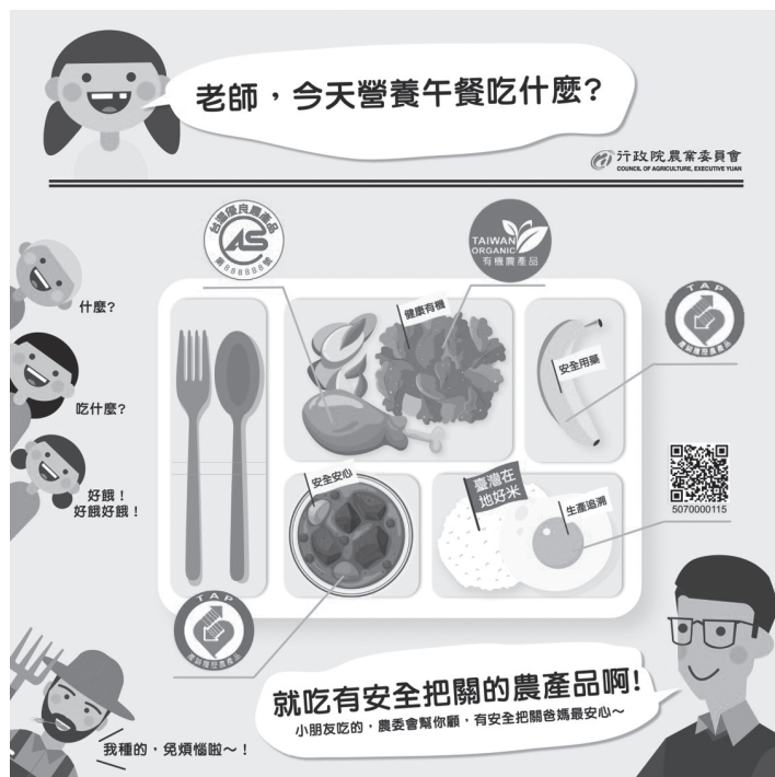
圖 1. 三章一 Q 國產生鮮食材幫學校午餐把關。

列經費補助各直轄市及縣（市）政府，同時由農委會逐年公告該年度獎勵金方案或要點，作為各直轄市及縣（市）政府辦