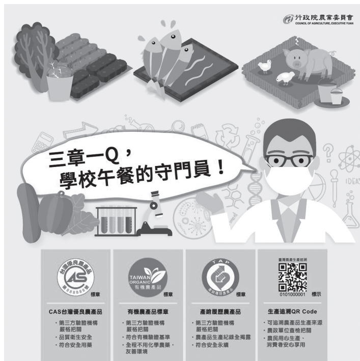
圖 2. 三章一 Q 國產生鮮食材是學校午餐的守門員。

三、為確保學校午餐食材為可溯源，爰推動之國產可追溯生鮮食材，包含具農委會推行之農產品標章、標示之農產品，或地方政府推行可溯源之在地食材及學校自