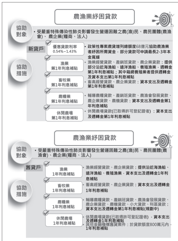
圖 2. 農漁業紓困貸款協助對象及措施。