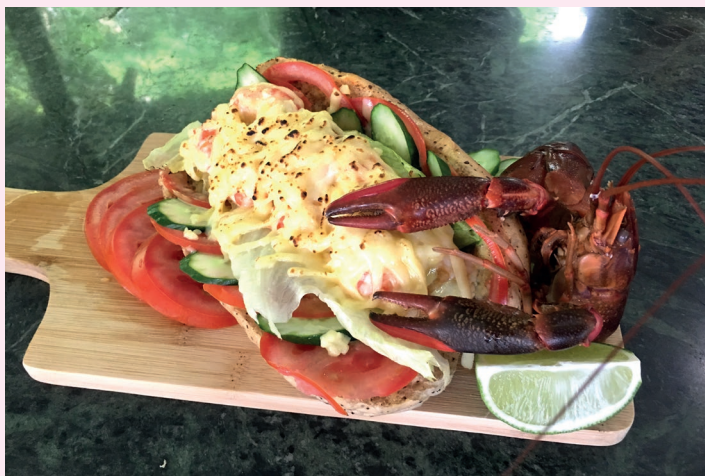
花蓮豐山社區——蝦飽堡料理。