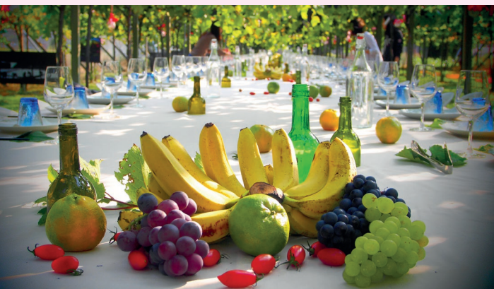
臺中永豐社區——葡萄園下餐酒會。