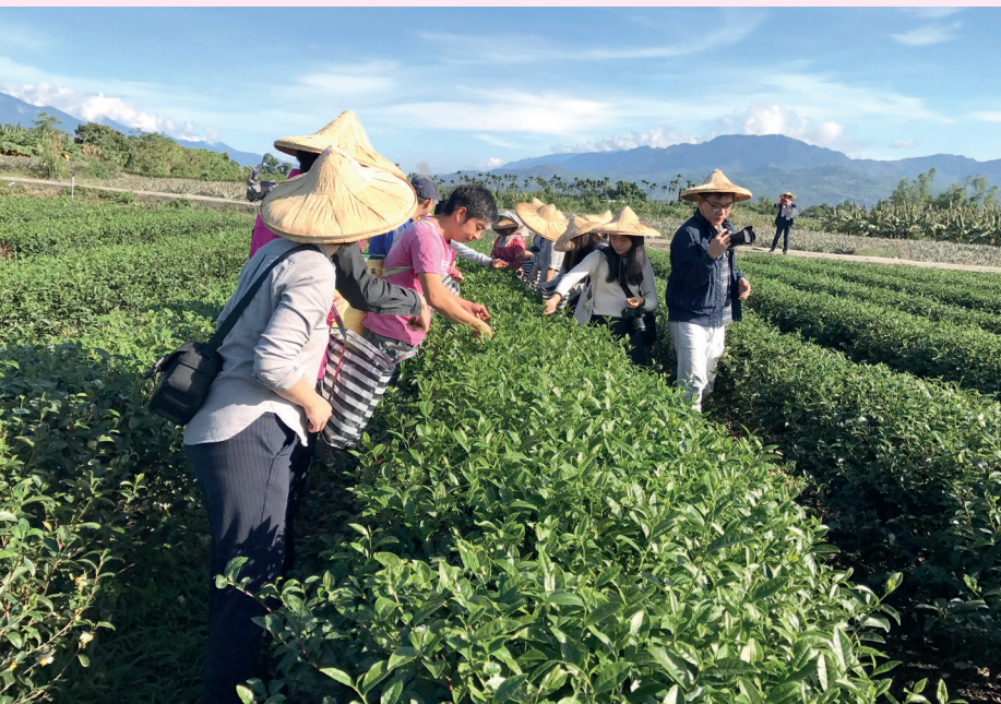
臺東饗嚮——採茶體驗。