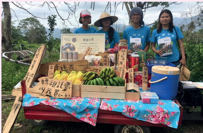
臺東饗嚮——鹿野農遊樂園。

望向花蓮新城海岸線，跟著洄遊吧青年，一起揭密七星潭海灣的古老漁法。再來壽豐豐山社區，親子同樂抓龍蝦，體驗「蝦叭料理蝦堡飽」。飽餐完畢到壽豐米棧社區，隨著阿美族迎賓舞來趟Ci Puypuya'n文化體驗之旅。想再認識阿美族嗎？還可以到光復鄉馬太鞍體驗巴拉告補魚，利用