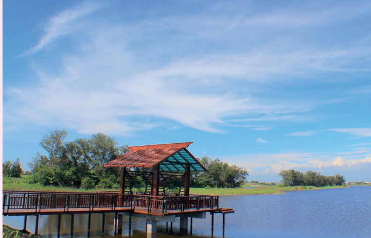
雲林金湖休閒農業區——宜梧滯洪池打卡熱點。

來到南投集集鎮，山蕉吃、喝、玩、樂盡在集元果觀光工廠。往水里謝謝農場走，梅樹剪枝呆呆筆藏情韻。農村網美照則到雲林虎尾北溪社區，剪紙藝術大道好文青。肚子餓了到雲林林內教芋部，聽聽教芋部長分享種育香甜綿密芋頭小秘訣。雲林口湖的金湖休閒農業區端出一道道海味佳餚，搭配成龍溼地賞夕陽，絕對是五星級享受。