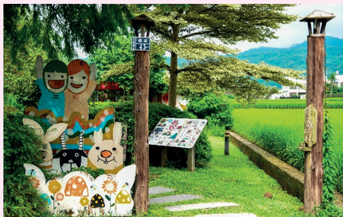
苗栗福星社區景觀。

中部來到臺中外埔水流東桐花飄香觀高鐵，葡萄園下餐酒會。后里泰安社區尋舊山線鐵路、文化有秘境。東勢軟埤坑採果、生態導覽。新社山城體驗瓜果花香賞螢趣。結合磚窯工藝、茉莉花產業，彰化花壇生態之旅有深度。如想與蝴蝶有約，跟著南投仁愛東岸部落的賽德克族人腳步準沒錯。走到埔里桃米生態村，社區及休閒農業區偕同青蛙老闆熱烈歡迎你！順道去埔里一新社區茭個好朋友吧，為白魚復育盡份心力。