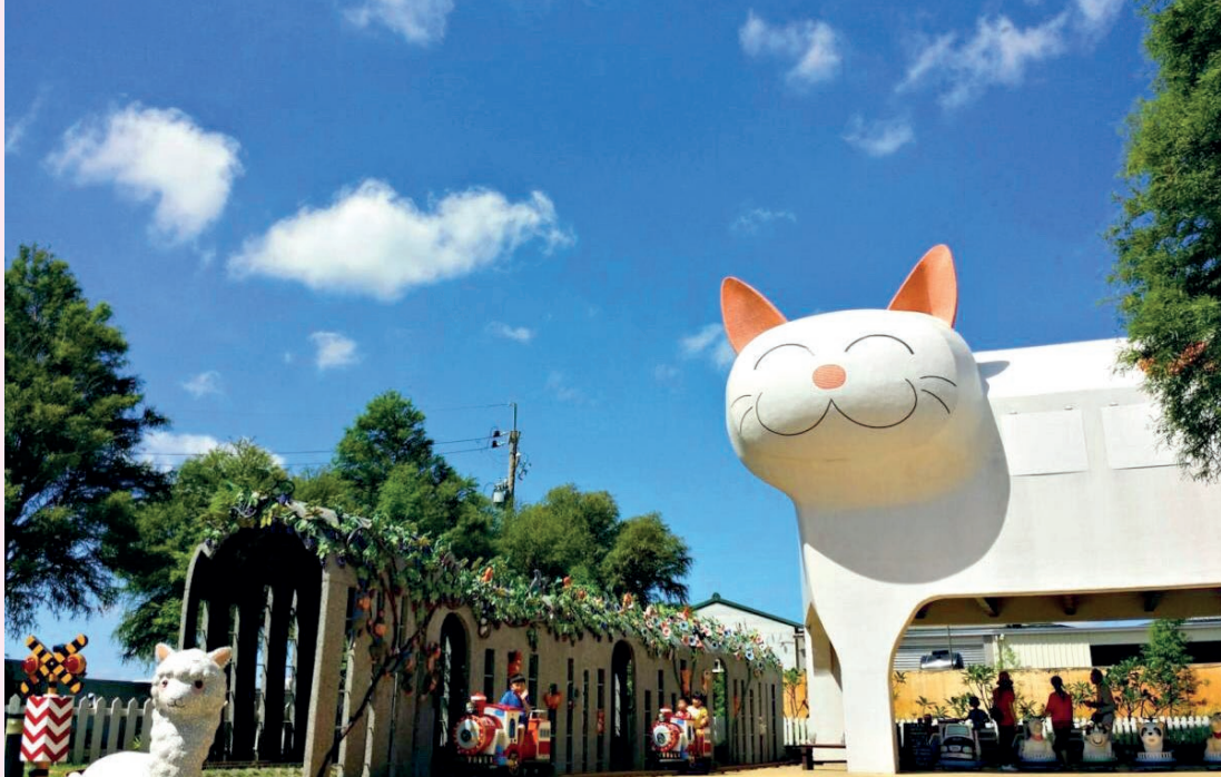
嘉義板頭社區——板陶窯。