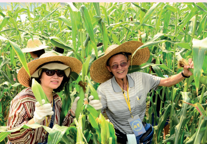
雲林北溪社區——採玉米體驗。