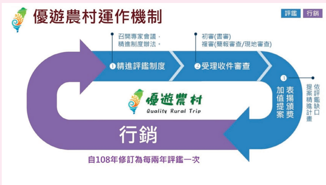
優遊農村運作機制。

區自我檢討精進，以達自主發展，共同提升整體服務品質，建構優質及友善的農村體驗環境。