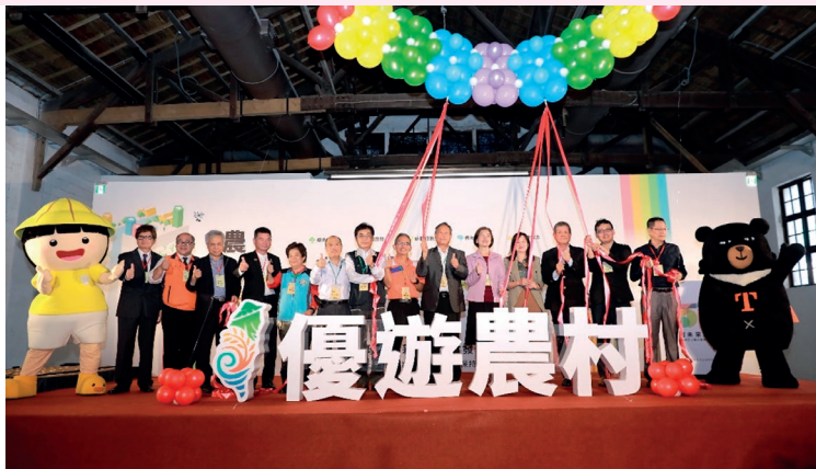
啟動優遊農村品牌。