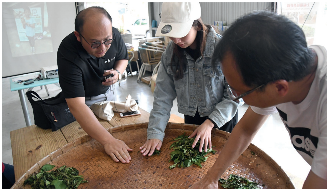
澀水社區揉茶體驗。