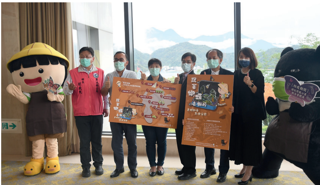
「生命之歌——跟著蝴蝶去旅行」記者發布會。

臺灣位於板塊交界，造就了臺灣山地面積占了全島面積70%，衍生了獨特的島嶼生態、多變的地形地貌、原民文化及歷史遺跡等，如此森羅萬象得天獨厚的自然資源及人文資源，孕育出臺灣深厚的觀光旅遊資源。