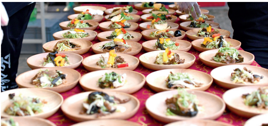
樹葡萄的餐桌饗宴。

進而產生愛護心，創造永續發展的環境、保護自然資源，讓我們來趟山脈探索之旅！詳細訊息及活動，歡迎上脊梁山脈旅遊年網站 ( https://www.theexhibitionhaofmountaintourism.com/ )、日月潭國家風景區管理處網站 ( https://reurl.cc/e8xMIK ) 及農村小童臉書 ( https://reurl.cc/e8xMYx ) 查詢相關活動訊息。