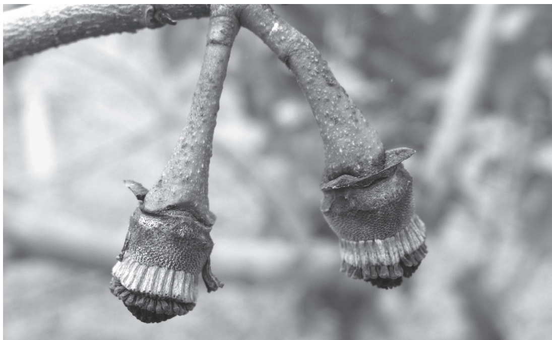
圖3. 刺番荔枝果實停滯期外觀。

栽培時，由於臺灣的氣候變化較熱帶地區複雜，刺番荔枝會因應季節的轉換而調整生育周期，乍看之下會感覺有點凌亂，果實沒有固定的產季，但詳細調查後，發現具有一定的規律性。在冬季氣候不良時，刺番荔枝會發生落葉，春季時再重新抽梢，待葉片成熟後，開始大量分化花芽，並於