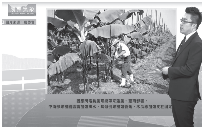
氣候變遷及特殊天氣事件造成農業損失，有必要提前防範。