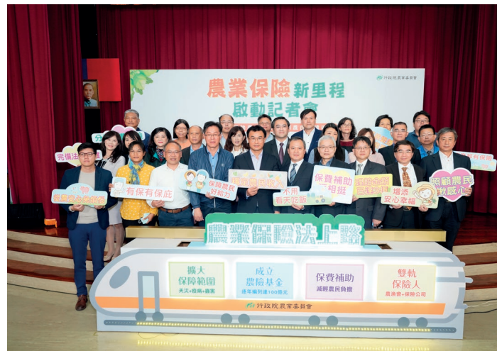
農業保險法於110年1月1日上路（第1排左5為農委會陳吉仲主委）。

(一) 擴大保障範圍：保險事故不以天然災害為限，疫病、蟲害、市場價格波動造成收入的不確