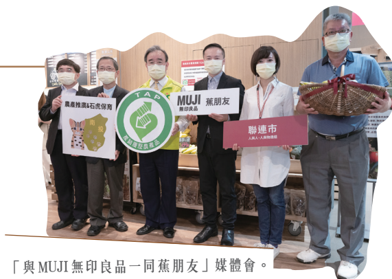
「與MUJI無印良品一同蕉朋友」媒體會。