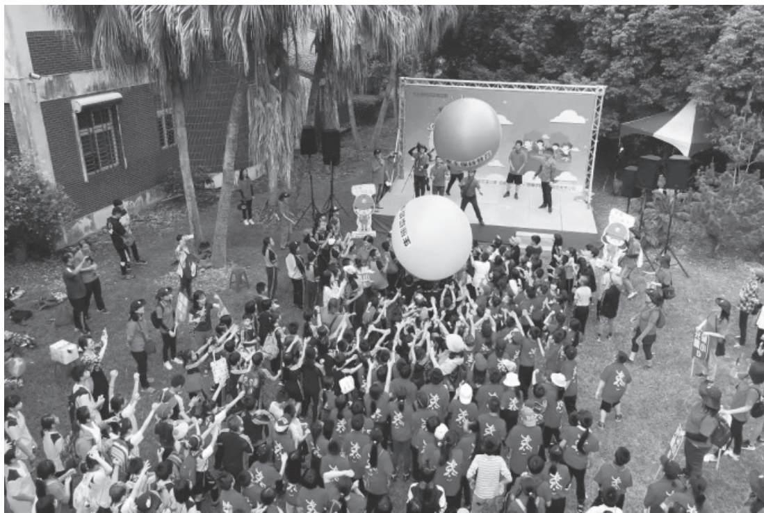
水保局花蓮分局——水土保持月教育宣導活動。