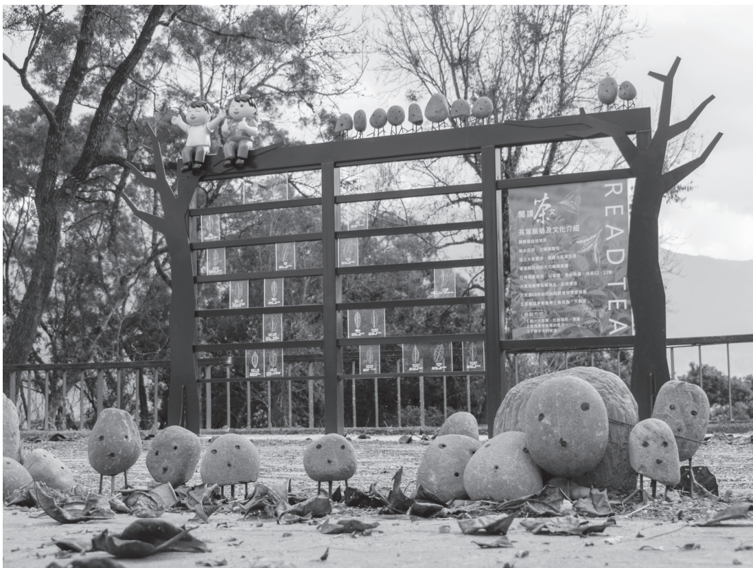
水土保持教育設施——閱讀茶「文」。

持教室的教學場域，重新營造富源茶莊2樓閒置空間為室內教學場域外，更打造多項戶外特色水保教育設施吸引使用者參與，透過秀姑巒溪的石頭創造石頭鳥，帶領使用者一探園區內坡度密碼互動設施的奧秘，並透過適當的雜木疏伐，改善林木生長的性質，促進林木健康，也提升園區對外的通透性，將秀姑巒溪的美景盡收眼底，並結合導覽解說歷史故事，感念