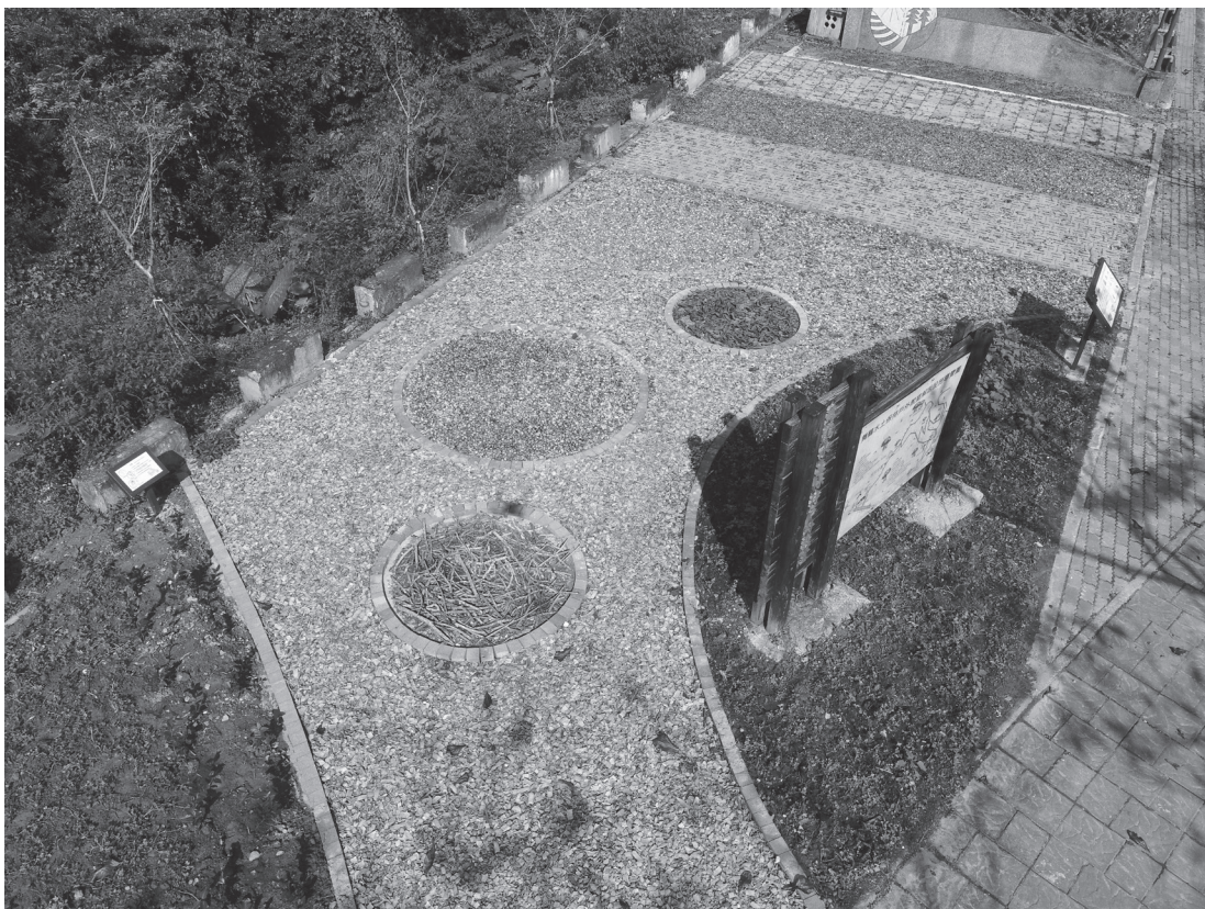
水土保持教育設施——透水鋪面。

舞鶴水土保持教室結合生態與教育，利用對於環境低衝擊之工法打造各項互動式水土保持教育設施，在安全的原則下結合生態、地貌及景觀，充分提升園區生態性及趣味性。線性步道坡度平穩，地磚鋪設平整度佳、自然資源豐富度高，產業文化底蘊深厚，形塑花