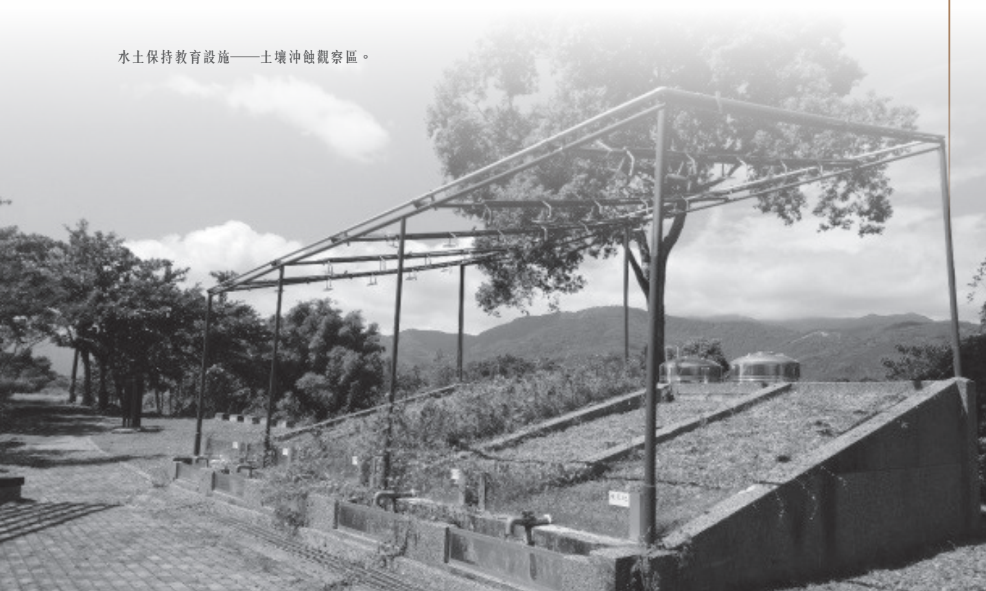
水土保持教育設施——土壤沖蝕觀察區。