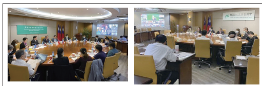
109、110年臺灣菲律賓雙邊農漁業會議，以視訊方式召開。