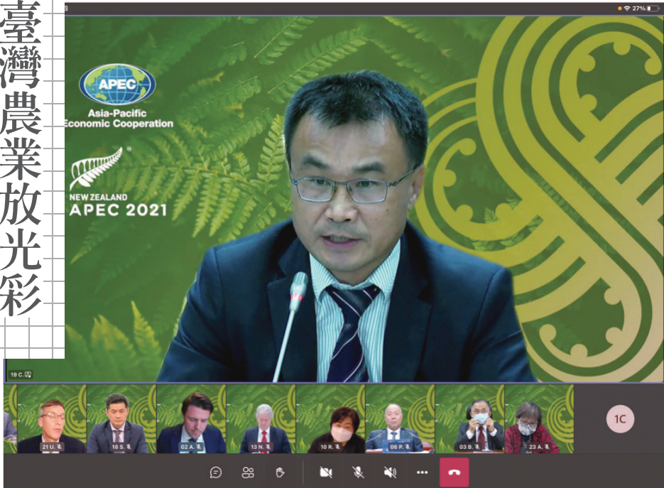
110年農委會陳吉仲主任委員出席APEC糧食安全部長視訊會議，闡述我國糧食安全政策推行情況。