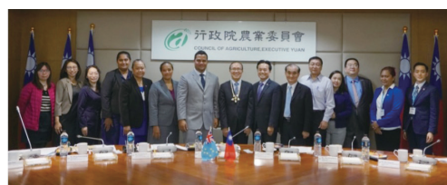
108年友邦吐瓦魯國外交部柯飛部長到訪農委會進行交流。

農委會作為我國農業的主政單位，推動各項農業國際合作時，在我國產業利益及外交利益天平兩端取得平衡，一方面積極向國外取得知識、技術與品種以挹注國內產業進步，另一方面則傳遞我國農業優勢技術，並且以透過境外授權等智財權機制，降低技術及品種外流回銷風險，同時也開創產品國際市場利基，持續不輟地追求與各國互利共贏的理想合作模式目標，且讓臺灣成為國際舞臺要角。