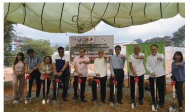
108年菲律賓碧瑤洋菇農場動土典禮實況。