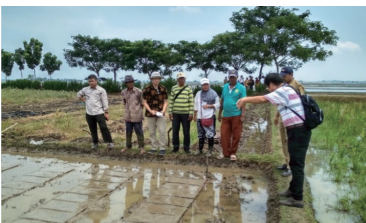
108年我國農業專家赴印尼卡拉旺地區指導水稻育苗。