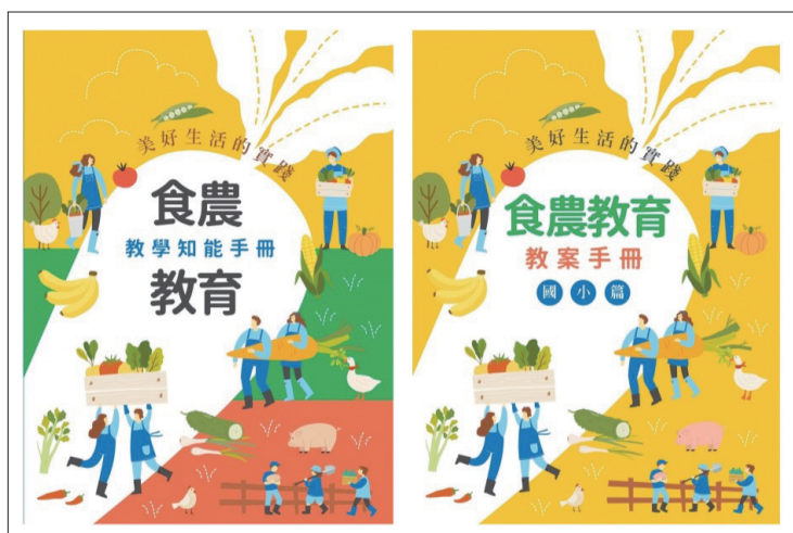
為學校教師量身編撰食農教育教學手冊。

式完整呈現各個作物的學名、主要特徵、重要品種、生產概況、種植過程，以及營養成分、選購原則、保存方法、烹調方法。未來國產農漁畜產品教材將持續撰寫及編修，以健全食農教育的農業基礎知識來源，建立科普化的教學資源，傳達正確的農業知識。