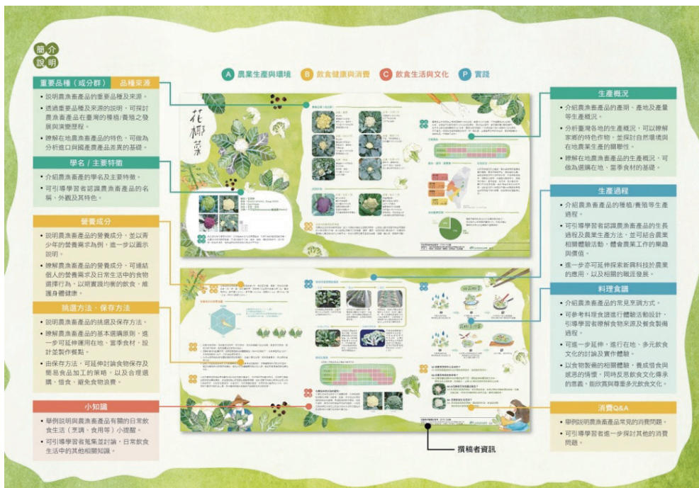
農委會編製國產農漁畜教材，提供食農教育所需農業專業知識。

為了提供正確的農業知識給有興趣推廣食農教育的單位及教師製作教案教材，農委會集結專業的農業研究團隊，包括農業試驗所、水產試驗所、畜產試驗所、藥物毒物試驗所、特有生物研究保育中心、全臺各區的農業改良場、茶業改良場及種苗改良繁殖場等14個單位共同編撰，並經相關學者專家審閱出版55個品項的「國產農漁畜產品教材」(第1冊)。每個單元的教材對應食農教育內涵的3大面向——「農業生產與環境」、「飲食健康與消費」、「飲食生活與文化」，以圖文對照的方