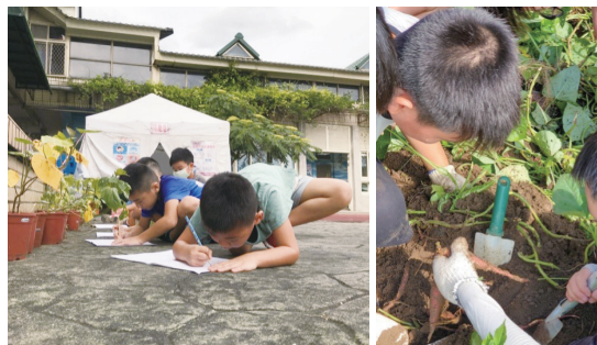
新北市中角國小，學生觀察甘藷生長後填寫記錄單。 新北市中角國小，學生實際種植甘藷。

以金山地區在地的農作物「甘藷」為主題，與校外農場合作，規劃6個單元18節食農教育課程，融入各學習領域課程（生活、藝術、健康與體育及自然等），讓孩子們瞭解「甘藷」的營養價值、生態地位、品種、採收與保存、烹調方式及加工品製作體驗；從甘藷種植的照顧及友善防治