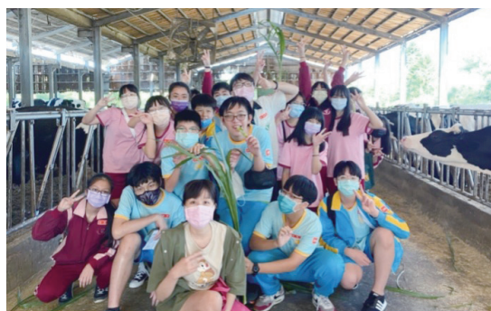
桃園市內壢國中，學生參訪酪農場。

病蟲害的角度切入，加上農業生產與環境及飲食健康等層面深入探討，讓孩子們在獲得身體健康的同時，也學會保護生活環境。