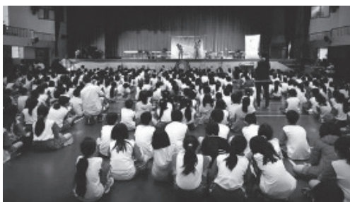
透過行動劇，讓孩子從快樂中學習。