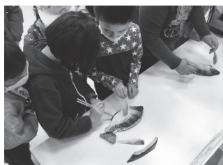
要鼓勵孩子嘗試吃魚，學習挑魚刺是第一步。

自106年起，漁業署補助民間團體走入全國小學辦理食魚講座，講座內容以「蠶旅奇緣」為系列主題，並創造小魚貓作為推廣代言主角，每年設計新劇情帶給學童新奇感，透過幽默趣味之行動短劇及互動十足話劇表演方式，內容涵蓋魚營養、魚料理、辨識魚種、挑魚刺、標章認識，參與學童亦有相關課程學習單，讓小朋友在趣味輕鬆之狀態學習食魚知識。