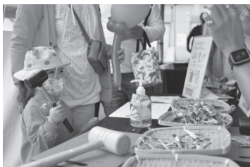
透過大型戶外親子活動，讓民眾有更多場域可以接觸到食魚教育。