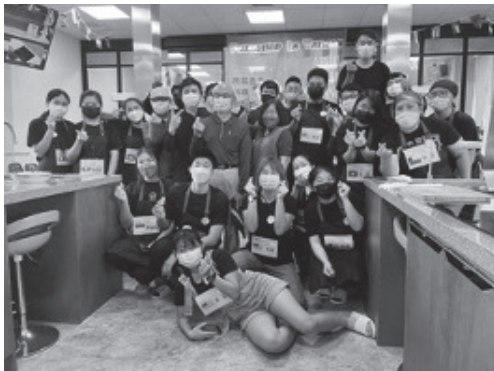
藉由漁業署補助建設食魚教室，提供民眾有更多接觸國產水產品的方式。

中、南三區擇定漁業發展蓬勃的基隆、臺中與高雄三地作為食魚教育推廣核心區，補助基隆區漁會、台中魚市場股份有限公司及梓官區漁會相關軟體設備，利用既有建物空間打造食魚教室，並輔導三單位持續與社區及校園合作，定期邀請學童參與結合在地特色體驗活動，瞭解漁業文化的來龍去脈，特色漁產的捕撈、生產、加工技術，時令漁產之挑選、烹食技巧，提升學童食魚意願。