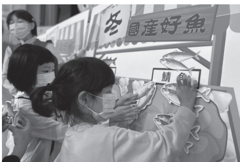
藉由行動劇及互動，讓孩子認識國產水產品。

107 年則拓展至教師、營養師族群，辦理與漁業知識相關的研習活動，除聘請專家學者上課外，更導入現場導覽課程，透過至各單位參訪，讓學員從單純吸收知識進階到活動體驗，增加學員將研習成果帶回學校課堂的豐富度。