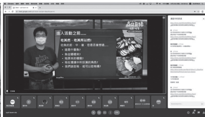
因應疫情將研習課程轉為線上，也讓離島教師有更多研習機會。