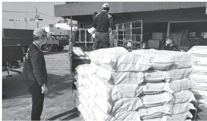
社會救助糧分發配送情形。

部政策納入食物銀行體系及社區照顧關懷據點所需救助食米；106年更將原民健康文化站及原民家庭服務中心等辦理餐飲服務提供老人共餐所需白米納入供應對象；該要點發布以來已逾19年，雖經數次修正，仍有精進必要，故以111年6月20日農授糧字第1111095972號令再次修正相關條文。