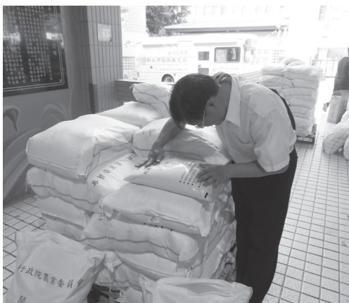
社會救助糧發送前抽驗品質狀況。

向農糧署各區分署申請；若有緊急需求，可逕以緊急救災食米申請書取代計畫書，採傳真方式向分署申請。