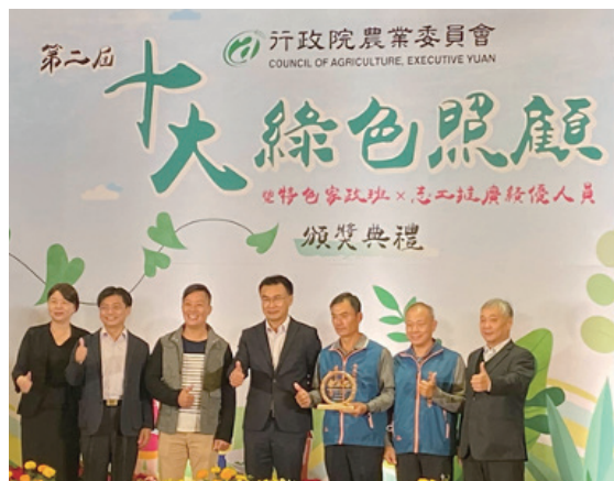
十大綠照頒獎現場（中為行政院農業委員會陳吉仲主任委員）。

在綠陪伴方面，推動社區健康促進活動，社區安排有益長輩身心健康的動、靜態活動，以促進長者活動、增強肌耐力、預防延緩老人失智、療育課程、團康特色活動等。綠飲食方面，社區由志工輪流備餐，餐點部分，由營養師建議適合長者食用在地生產之營養蔬果，每周供餐3天，每年供餐人次可達6,700人次。綠療育方面，針對65歲以上長者，辦理多肉植物種植及手部肌肉靈活協調運用，每年服務可達800人次以上。在推動