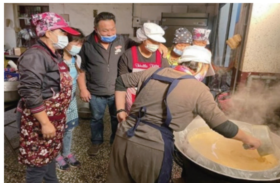
開發在地健康高齡餐食——後龍埔頂社區。