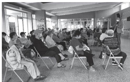
校長與社區長者說明學校教育理念。

水尾社區人口數約 1,166 人，老年人口數為 529 人，約占 45.37%，而成功國小的學童數（含幼稚園）約 56 人，顯示社區的人口有顯著的超高齡與少子的現象。因此，推動社區老者綠色照顧，以及國小特色化的教學，成為現階段水尾社區的重要議題。然而，位於苗栗縣後龍溪出海口的沿海地區，社區服務缺乏青壯年的人力資源，在此情形下，社區發展協會成為照顧長者與幼童的主要角色。