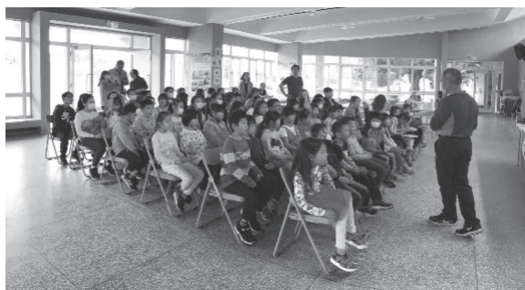
社區幹部與小朋友介紹社區發展協會。