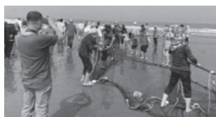
牽罟是水尾社區傳統漁法之一。