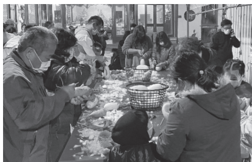
祖孫共同製作元宵節蘿蔔提燈。