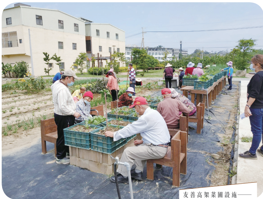
友善高架菜園設施—— 後龍溪洲社區。