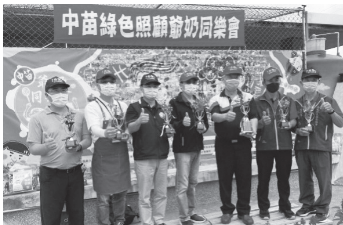
中苗爺奶同樂會頒獎典禮。