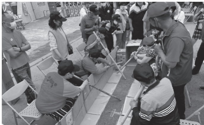
棒子足球趣味項目。

為使綠色照顧政策更精實地推廣於中苗農村社區，111年4月30日於水尾社區舉辦了「中苗爺奶同樂會」，不僅藉由同樂會展現綠色照顧多元豐富的面向，也安排了中苗14處農村設置攤位展現各社區實施綠色照顧亮點與特色，促進社區間的觀摩與交流，打造中苗綠照農村社區橫向連結之網絡，深化發展綠色照顧，提升農村幸福感。