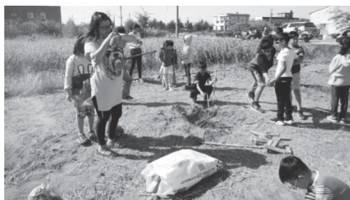
沙地控窯的在地知識傳承。