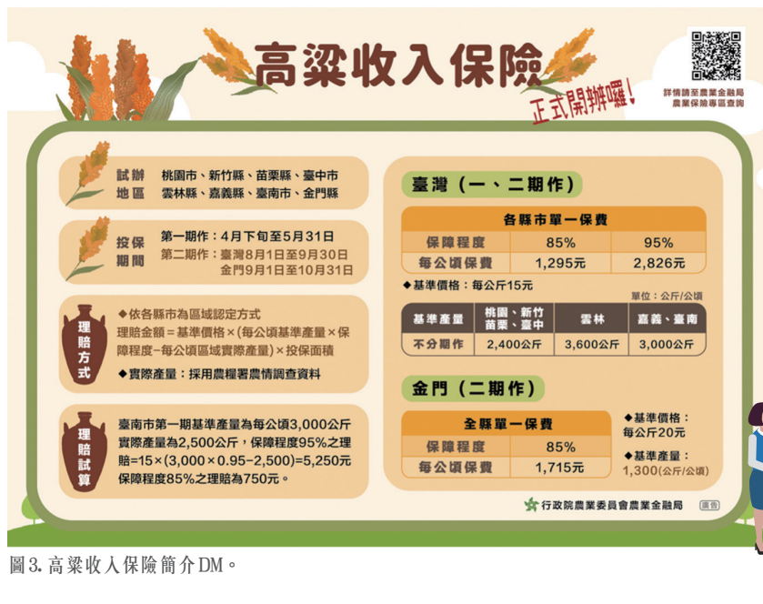
圖3. 高粱收入保險簡介DM。