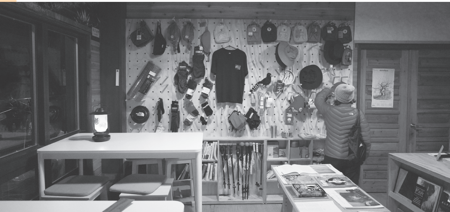
天池山莊餐飲及登山遊憩服務委託專業團隊營運提升服務品質。