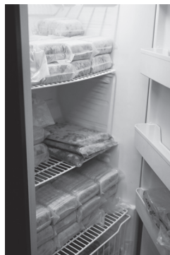
部落廚房料理後以真空包裝冷凍存放。

可惜舊有的合作基礎，尚不足以因應山林開放後的人潮壓力。爰林務局南投林區管理處（簡稱南投林管處）進一步推動下列配套精進措施，加強