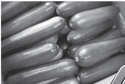
使用在地農產品規劃菜單食材——在地部落生產之節瓜。

能高越嶺道西起南投縣仁愛鄉霧社，沿著塔羅溪上行、越過中央山脈能高鞍部，而後下木瓜溪抵達花蓮縣秀林鄉，全長約83公里，是早期往來臺灣東西部的捷徑，為日人警備道中最寬闊、平穩的一條。如今除部分公路化路段外，林務局整建其中屯原至五甲崩山間27公里之路段為國家步道，沿線可見標高3,262公尺的能高山，並可順登奇萊南峰、南華山（能