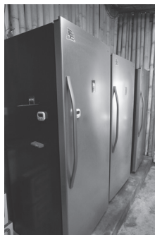
於當地部落廚房投入硬體設備——冷凍冰箱。