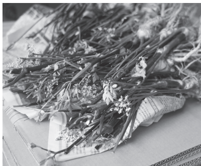
使用在地農產品規劃菜單食材——野當歸。

喜愛度則由2019年之13.8%大增至2021年之18.5%，穩居第二名。林務局部分，除了傳統百岳數線的山屋營地，申請人數成長75.37%之外，過往相對冷門、陌生的自然保護區域，在親近山林的思惟下，結合網路自媒體的網美照風潮，申請進入的人數則大幅成長432.86%（月均17,627人次），宛如「爆紅」，故整體登山活動及山林旅遊熱潮，有普遍上揚之趨勢。