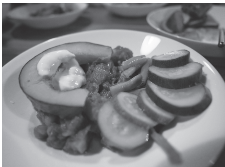
開發無廚餘菜單——樹豆咖哩套餐。