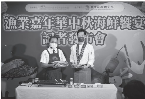
圖2. 漁業署張致盛署長(左)與龍師傅現場示範燒烤水產品。

擔的目標，近年來各漁會也積極研發多項產品，推薦消費者選用臺灣鯛、石斑魚、白帶魚、竹筴魚、午仔魚、香魚、白蝦、小卷、文蛤、鯖魚、鰻魚、秋刀魚、帶殼牡蠣等優質的國產水產品作為中秋燒烤食材，讓國產魚能展現不同的面貌及各自的特色！