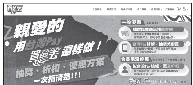
圖3. 漁業嘉年華「買魚去」活動頁面。

本次漁業嘉年華—中秋海鮮饗宴記者會活動，由多家漁會、協會、產銷班及合作社等產業團體一同參與，透過活動結合業者生產能量及通路推廣力量，加速技術商品化並促進產業升級，有助於開拓我國水產品加工製品通路市