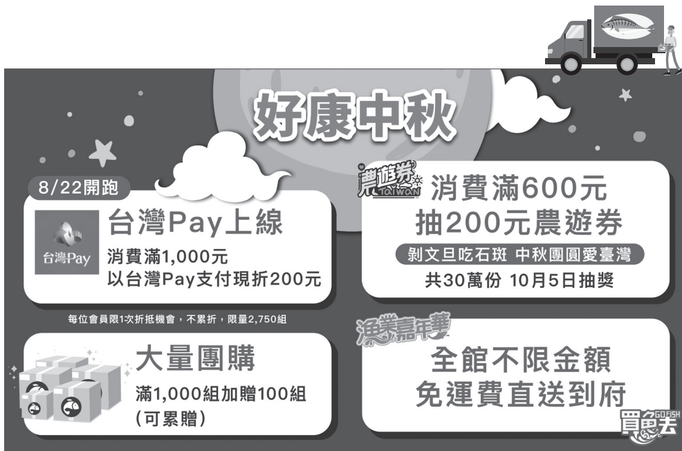
圖4. 漁業嘉年華平臺中秋佳節多重優惠。

場，透過產、官、學界相互交流，協助水產食品加工業者朝向特色化、精緻化及在地化發展，開創新商機，進而穩定產銷。接續本次活動，漁業署將於今年10月初舉辦石斑魚產品多元化推廣記者會活動，攜手漁會、養青等產業團體，推出讓大家為之驚豔的國產石斑魚產品，讓消費者知道水產品不只能作為高營養價值的食材，也能作為我們日常生活的保養、化妝品。