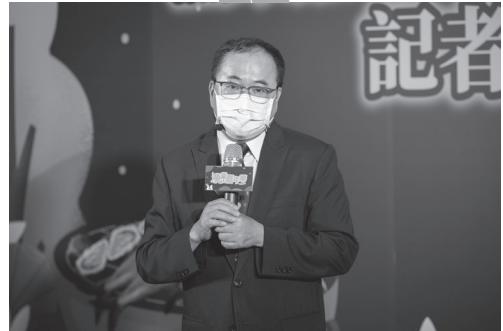
圖1. 漁業署張致盛署長介紹漁業嘉年華—中秋海鮮饗宴活動。

多項水產品出口受阻後，農委會及漁業署趁中秋佳節的時機，啟動國內行銷方案。在今年8月16日，漁業署攜手財團法人農業科技研究院特別號召漁會、協會、產銷班及合作社等產業團體共同辦理「漁業嘉年華—中秋海鮮饗宴」活動，匯集超過20家漁