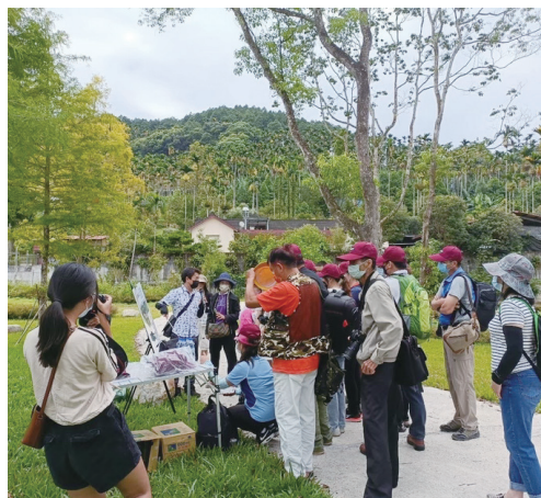
圖2.在南投縣魚池鄉鹿篙農塘現地攝影踩線團。