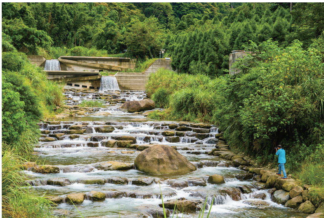
圖6. 大地視野銀獎作品《川流不息》(苗栗縣獅潭鄉大東勢溪)。

於優良水土保持跟農村再生工程建設相關的作品，透過這些精彩影像的分享及見證，真的讓我們看到在水保局的努力之下，在臺灣的角落上，有這麼多人在為臺灣土地上付出的心力，成就土地好山好水的願景。同時也恭喜所有得獎者及入選者，你們的鏡頭與視角都讓平凡的景觀有了生命力，鼓舞了我們繼續去探索臺灣的美好，也讓我們注視到農村再生與水土保持工程所發揮出來的成效，極具教育性。」