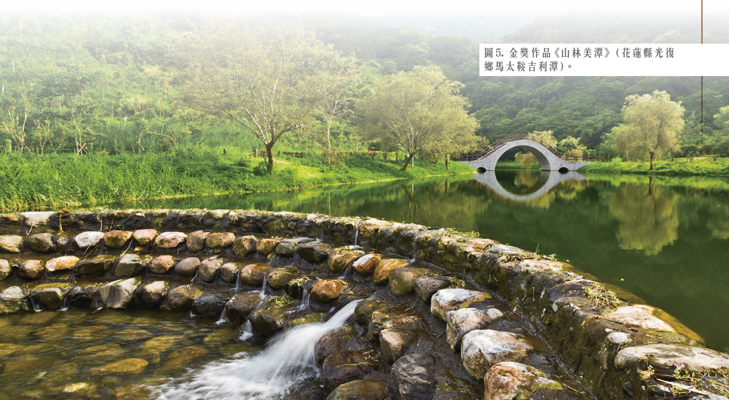
圖5. 金獎作品《山林美潭》（花蓮縣光復鄉馬太鞍吉利潭）。

第二位評審委員則說：「感謝承辦單位能夠邀請我擔任這次攝影比賽的評審，讓我有機會可以看到這麼多，有關