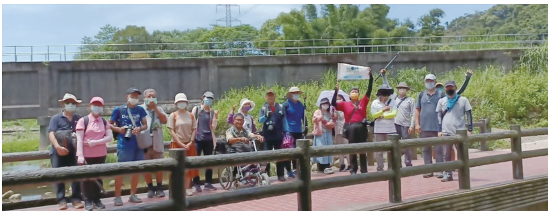
圖1.在桃園市龍潭區打鐵坑溪現地攝影踩線團。