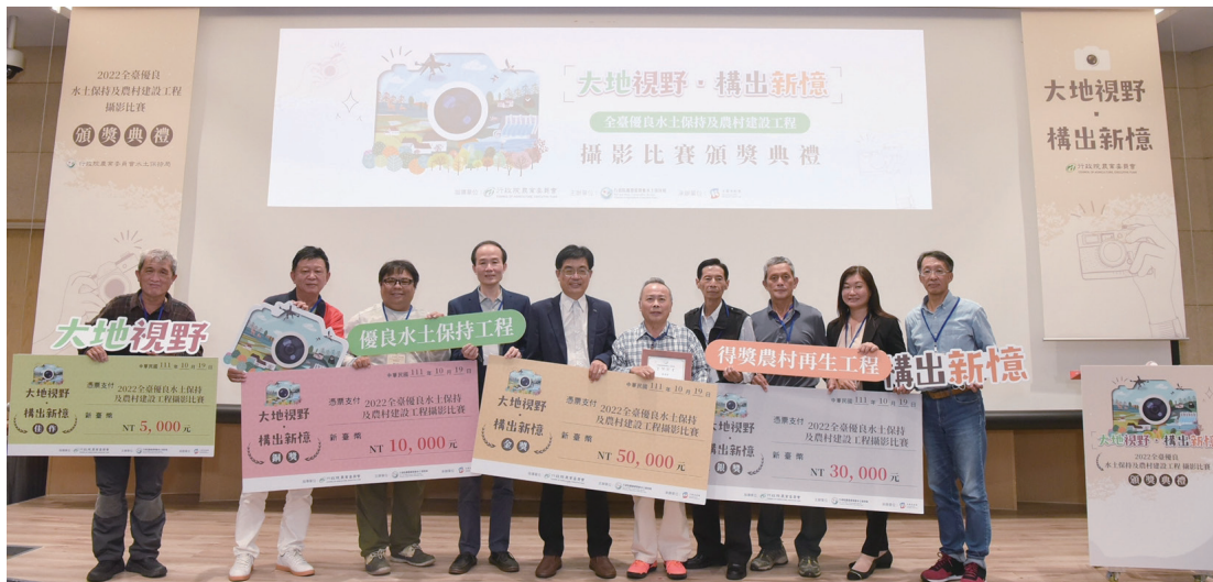
圖3. 頒獎典禮上的得獎者與頒獎者。