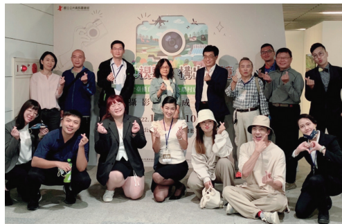
圖9. 辦理本次攝影比賽的水保局同仁及團隊工作人員。

這些獲獎的水土保持及農村再生工程、水土保持戶外教室及花蓮、臺東地區萬物糧倉大地慶典裝置藝術等攝影作品，充分展現水保局同仁（圖9）的用心設計，目前放在水保局的「水保酷學堂」（ https://www.kstr.com.tw/2022swcb/award.html ）、水保局全球資訊網及水土保持歷史影像平臺上，歡迎上線觀賞水土保持及農村之美。