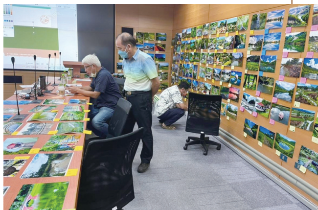
圖4. 攝影比賽評審現場。

整治後，自然景觀將永劫不復。然而，這次擔任水保局舉辦的『大地視野·構出新憶』全臺優良水土保持及農村建設工程攝影比賽評審，在評審現場仔細閱讀參賽的攝影作品，大大地顛覆我對野溪整治工程的刻板印象！參賽者透過影像作品的光影之美，凸顯水保局的整治野溪工程完工後所呈現生態溝渠、魚梯與埤塘之美。鵝卵石堆砌的邊坡、砌塊石護岸、波光粼粼的豐盈水塘，動靜皆美，兼具自然地景的知性與人文情懷之美的感性。尤其是，得獎作品中，透過作者的巧思，把散布在臺灣各地的野溪、拱橋、水塘的自然與人文造景之美表現得別有韻味，溪水潺潺，自然環境可愛、可親，讓觀者也想親歷其境『一親芳澤』！這批精彩動人的得獎作品用影