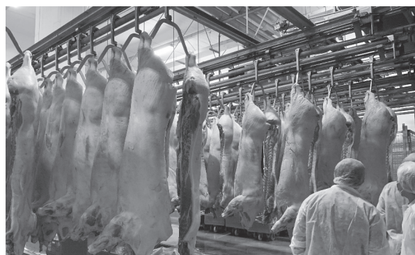
圖3. 專家團隊輔導屠宰場情形。

與「畜禽肉類加工產品外銷業者自評表」(下載位置：中央畜產會官網／產業訊息／畜禽產品外銷專區／外銷產品型錄與文宣品)，蒐集香港、日本及新加坡等國家之出口流程，以加工(熱)肉品輸日為例，首要條件為生產廠須通過日本書面審查及實地查核，該設施經日方核可後，方可依「加熱偶蹄類動物肉類輸日本之衛生條件」輸日，並須符合日方屠宰衛生及食品衛生等規定；申請輸出新加坡者，須注意產品是否含有牛肉，並根據該國食品局網頁確認產品分類與號列等(相關流程範例如圖1、圖2)。生鮮豬肉部分，目標國家日本要求豬肉屠宰來源須取得「屠宰場肉品衛生安全管制系統」(HACCP)證書，故農委會自109年12月15日積極推動相關制度，農委會動植物防疫檢疫局透過「精進屠宰