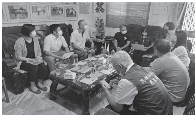
圖 9.110 年菲律賓農業部來臺查核種豬場情形。

協助產業拓展市場，增加產品銷售管道，具有分散整體經營風險之效。由於成本等因素，「臺灣豬」出口門檻較高，故更需要找出利基市場，策略性執行。農委會將持續培養業者國際觀，協助海外拓銷，藉由導入標準之同時，提高產業競爭力與生產水準。