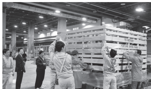
圖8. 種豬出口情形。

場肉品衛生安全管制點（HACCP）工作計畫」，於各地展開教育訓練，協助屠宰場導入危害分析、重要管制點與風險管制等管理概念，並受理驗證申請，農委會則執行「推動豬隻屠宰場現代化計畫」，籌組專家團隊赴現場給予屠宰流程與場域優化建議，協助導入新式設施（備），提升業者軟、硬體實力（圖3、圖4），截至112年1月，全國已有8家豬隻屠宰場取得HACCP證書，合計屠宰量占全國10%以上，豬肉屠體品質與衛生安全獲有效提升。