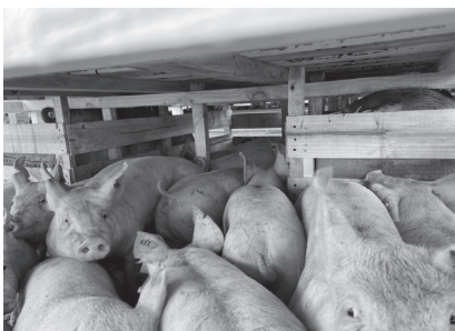
圖7. 種豬出口情形。