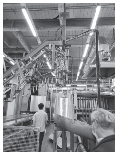
圖4. 專家團輔導屠宰場情形。