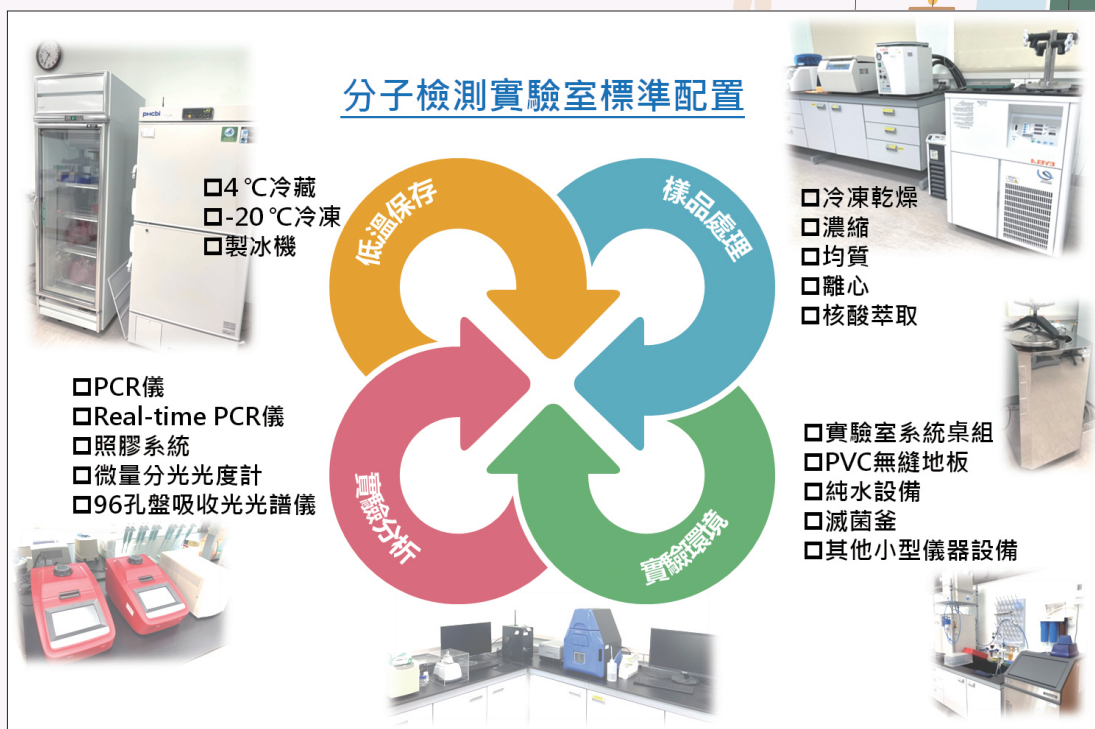
圖 2. Bio-Open Lab 之設備類型總覽。