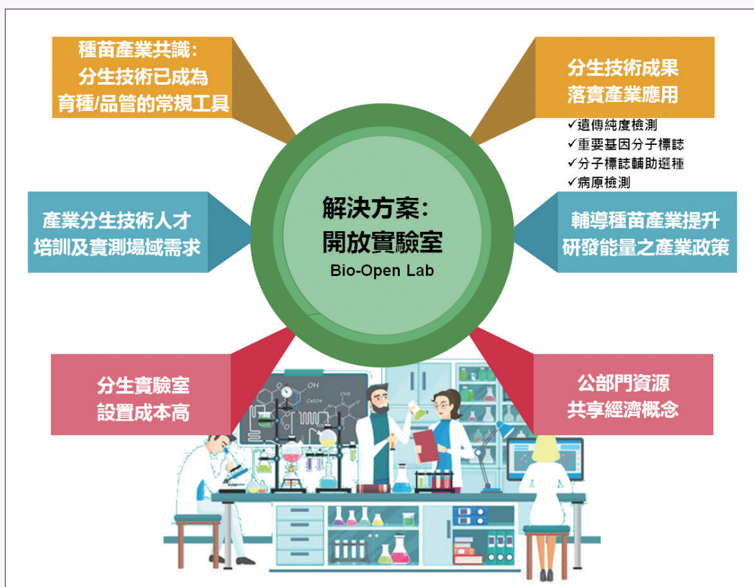
圖1. 設立種苗分子檢測開放式實驗室之擬解決問題。

應用分子技術輔助種苗新品種研發及品質管控已經是國際種苗企業研發的標準配備，且國內種苗業者對於分子生物技術的接受度也已提高，然而分子檢測分析實驗室需要動則數百萬、千萬的設置及相關維運成本，對於規模相對較小的國內種子公司而言是十分沉重的負擔，也造成新技術導入的困難。因此，若能先藉由外部資源來提高企業研發能量，待企業規模茁壯至一定程度後