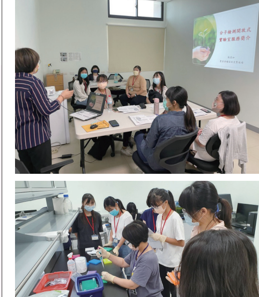
圖3. 2022年8月開辦為期4天的小班制種苗分子檢測技術基礎班訓練情形。

近年來由於科技的進步，作物品種推陳出新的速度加快，種苗產業競爭愈趨激烈；另一方面因為全球