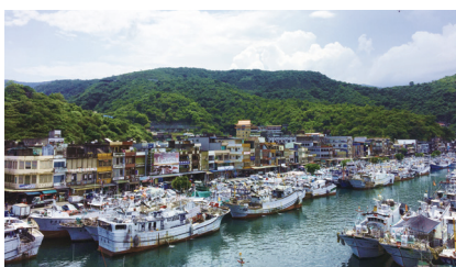
宜蘭縣南方澳漁港。