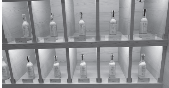
YANMAR TOKYO以「米」為主軸，透過展覽、體驗、餐食、特產來展現米和食的魅力。

度14度和濕度90%下進行貯藏，始其能於任何時候以高品質出貨，因此儲存性能的提升，則相對重要。具有溫度和濕度控制能力的貯藏庫，根據JA的資料，在平成27年時已經建立了14個倉庫，總計可貯藏約5,000公噸的產品。