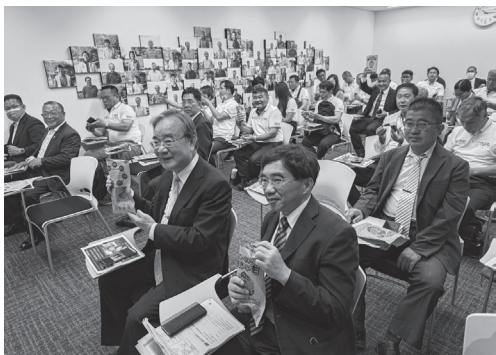
甘肅策略聯盟協同本團至JA行方甘肅部會聯絡會學習交流。

茨城縣笠間市面對人口減少及高齡化問題，生活與經濟均面臨挑戰，且應疫情影響，問題持續擴大並加速進行中。笠間市「數位田園都市國家構想總和戰略」以實現Society 5.0及SDGs為目標，打造多元化就業環境，並利用現有設施形成「新據點」，及強化笠間市特色「長處」，致力提高「魅力」和「所得」，藉由政府、民間企業、農民或農民團體的合作，打造笠間品牌，活化閒置空間，