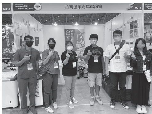
111年9月29日臺南漁青聯誼會參加臺灣國際漁業展。

金會、財團法人臺灣海洋保育與漁業永續基金會及中華民國養殖漁業發展協會等單位，協助輔導縣（市）漁會、養殖協會或漁民成立漁業青年聯誼會，補助各聯誼會辦理漁青所需教育訓練及異業交流活動，並提供聯誼會成員智慧設備與漁機具補助等措施，另，產銷履歷補助可優先加分，以鼓勵產業青年加入漁青聯誼會。