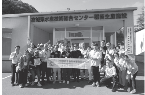
112年8月22日日本漁業永續發展研習團至宮城縣種苗生產施設參訪。

迄今，漁業青年聯誼會已成立彰化、雲林、嘉義、臺南、南市、高雄、屏東、宜蘭、臺東、定置漁業、