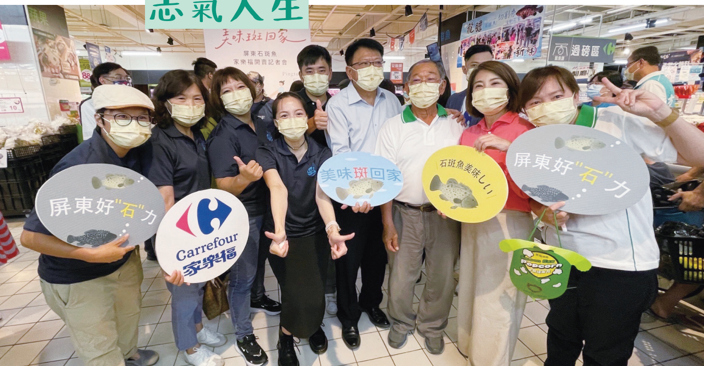
111年7月8日屏東漁青聯誼會共同推廣石斑魚。