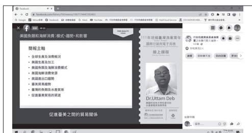
111年8月15日培植臺灣漁業青年國際行銷與電子商務課程美國篇。