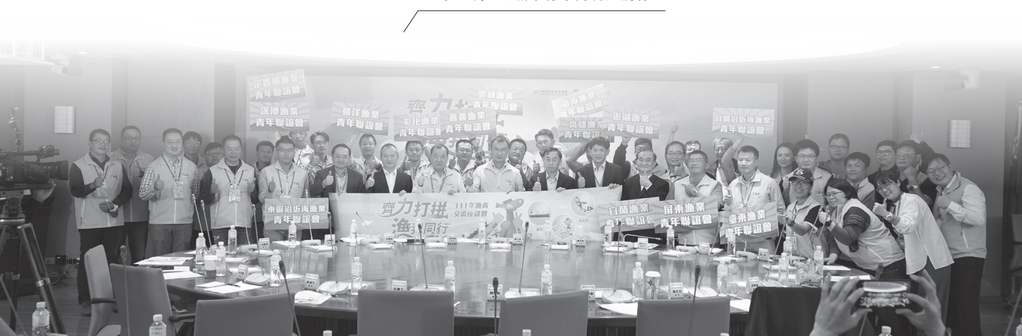
111年12月7日漁業青年交流座談會。