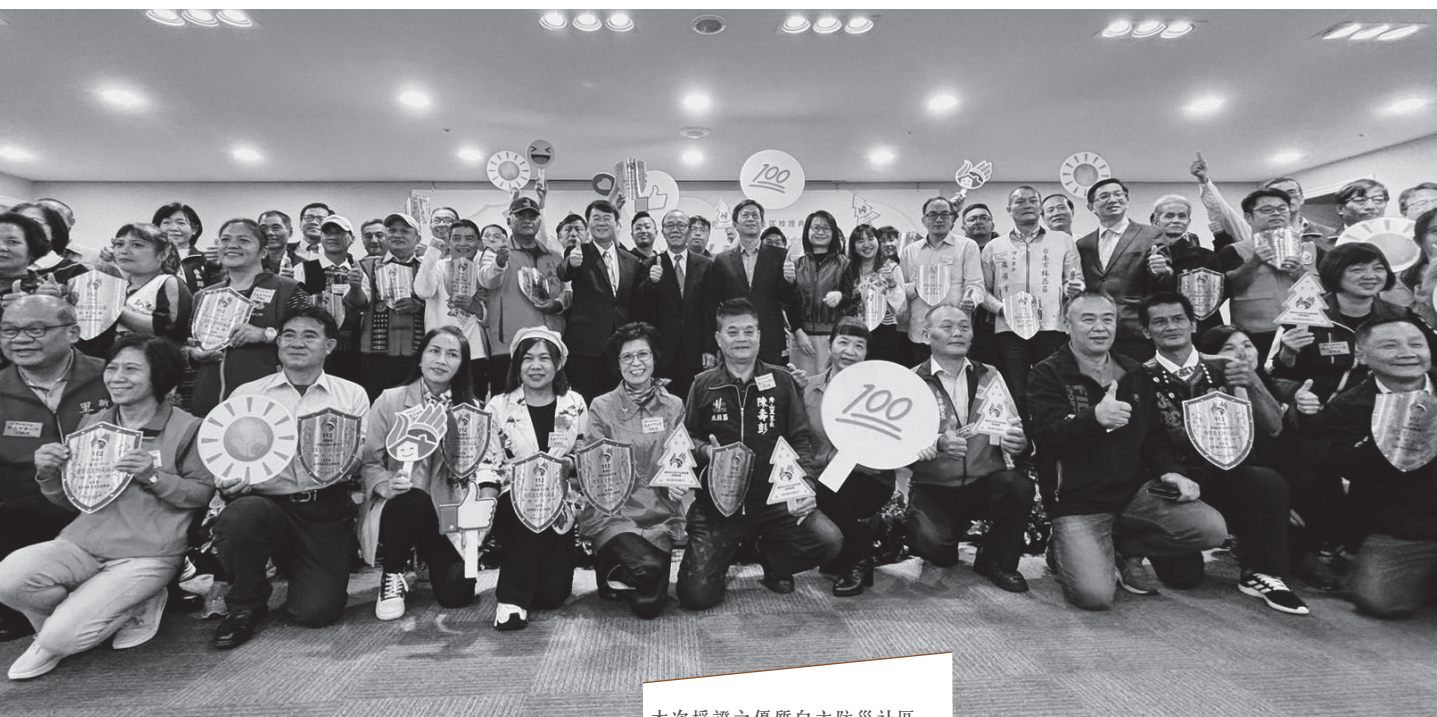
本次授證之優質自主防災社區。