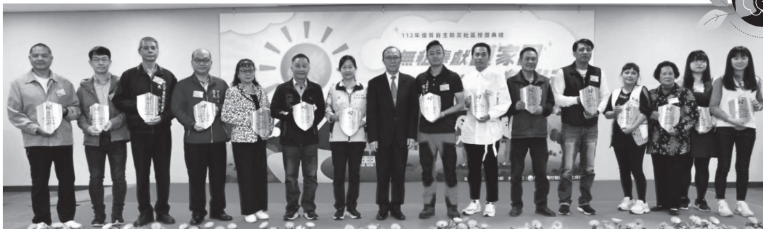
農業部陳添壽次長（左8）與銀質社區合照。

自主防災推動經驗，希望讓更多民眾認知災害的危險性與防災意識培養的必要性。另外活動也邀請農村水保署輔導之自主防災亮點社區（雲林古坑華山社區及臺東大武大鳥社區）分享自主防災推動特色與經驗。