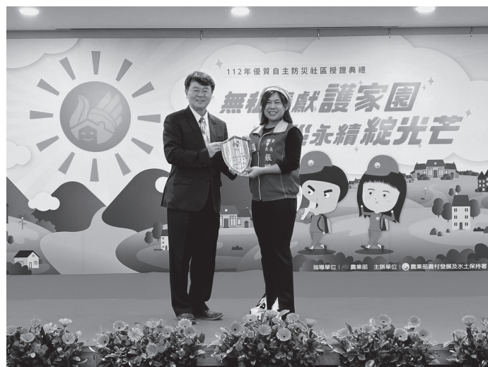
農村水保署李鎮洋署長（左）頒發銅質社區。

面對氣候變遷的挑戰，唯有中央、地方與社區共同面對，才能攜手共度每一次的災害，藉由自主防災工作推動，強化民眾與社區土地的連結，增加民眾的認同感與向心力，也讓更多民眾接觸防災議題，凝聚更多人的力量共同守護我們的臺灣。