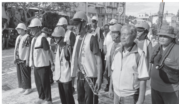
臺東縣金峰鄉正興村實作演練。