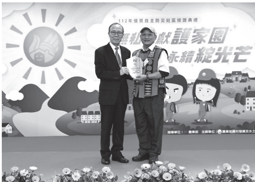
農業部陳添壽次長（左）頒發銀質社區。

為強化地方自主防災能量，於107年推出「自主防災社區 2.0 計畫」，以全民參與、由下而上、因地制宜的精神辦理。考量村里的環境風險、社經、人文條件不同，發展自主防災社區耐災能力分級，讓地方政府