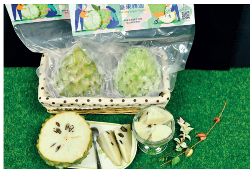
番荔枝策略聯盟開發出鳳梨釋迦全果冷凍新型態產品與高端市場酒品，創新拓展市場。