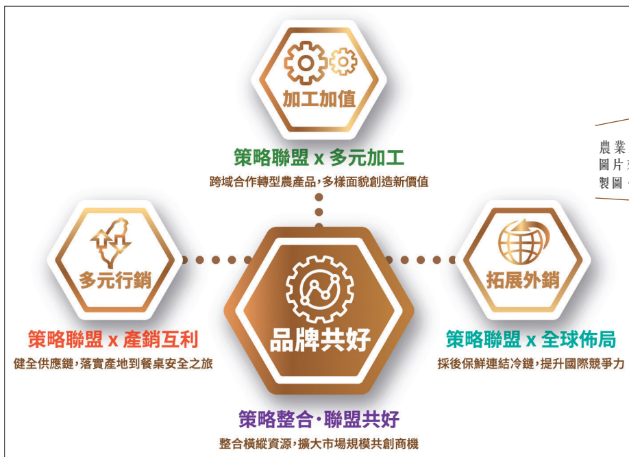
農業三箭行動整合圖。

農業生產到消費係一系列價值活動的串連，農業策略聯盟以價值共創為核心，透過組織合作與分工，帶動產業「共好與共榮」，並透過「多元行銷、加工增值、拓展外銷」農業三箭策略整合，在互利中發揮產銷調節功能，穩定農民收益，並提升產業競爭力。