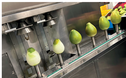
文旦策略聯盟不斷導入自動化設備，藉以提升作業效率與品質。

「加工加值」強調多元加工與跨域轉型。以多樣面貌創造農產品新價值，依循消費市場需求，與食品加工、生活用品或化妝品製造廠、餐飲業、通路業者等跨域合作，強化農產品製作與格外品多元加工研發利用，同時調整市場結構與通路，創造農產品新價值。如「落花生策略聯盟」透過技轉高油酸花生開發花生新品，讓氧化問題能夠被克服；「番荔枝策略聯盟」則運用催熟及全果冷凍雙技術，開發出鳳梨釋迦全果冷凍新型態產品，並將果品包裝朝即食性與方便食用的小包裝或截切，創新拓展市