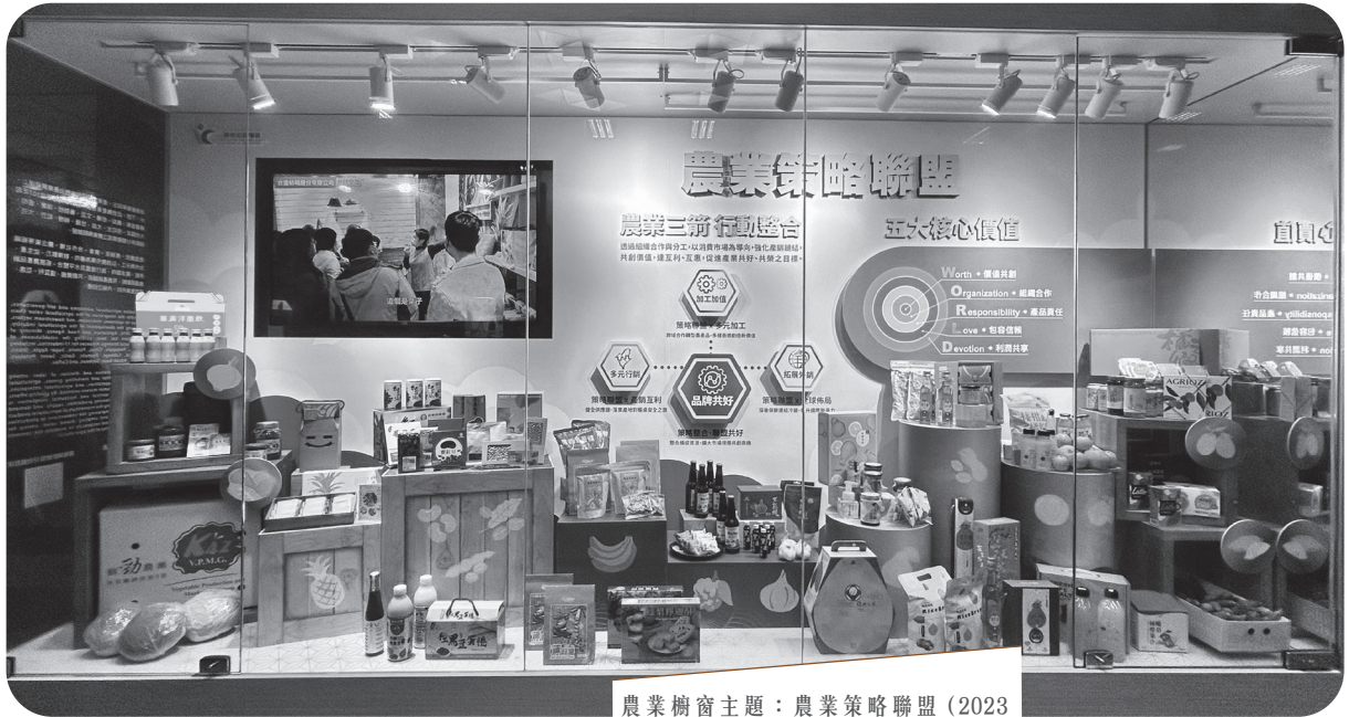
農業櫥窗主題：農業策略聯盟（2023年12月~2024年1月）。