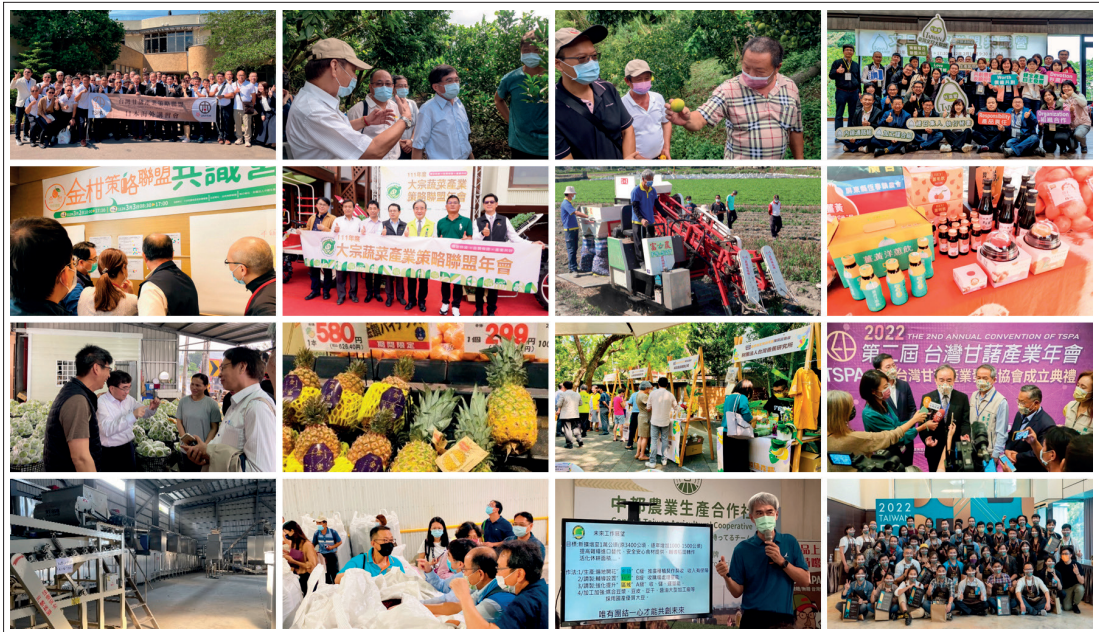
15 個農業策略聯盟分別落實農業三箭措施，以策略整合、聯盟共好為訴求，讓臺灣農業充滿商機及發展空間。

評鑑指標，提升外銷供貨及到貨品質；「咖啡策略聯盟」引進國際具公信力之「卓越盃咖啡競標」賽事，透過國際評審選拔國內品質頂尖的咖