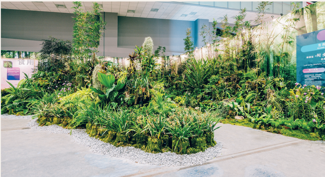
原生蘭特展讓世界瞭解臺灣對於原生蘭之復育成果及保育貢獻。

本次策展主題為「世界的臺南 臺南的世界」，結合大量蘭花布景，透過人花互動，提醒人們善待自然、謙卑共存，以保育復育、永續環境為使命。