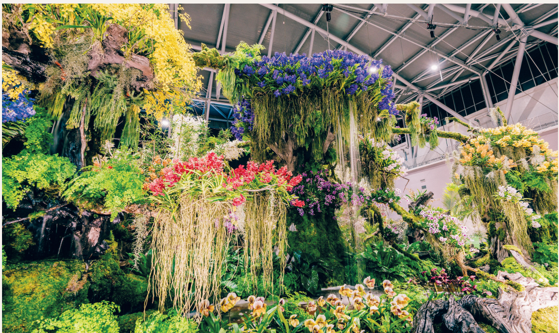
景觀佈置競賽第一名由泰國Korat Orchid Society × Damrong Star Club 布展之「微笑之國」獲得，作品表達泰國對於朋友、環境的友好。

流，充分實踐世界蘭展「全球參與」的重要目的，並向國際展演臺灣傲人的蘭花產業與保育成果，期望在推廣蘭花的同時，能喚起全球對原生蘭保育的重視，我們將延續這份精神，讓臺灣達成產業與保育並進、農業永續發展的理想目標。