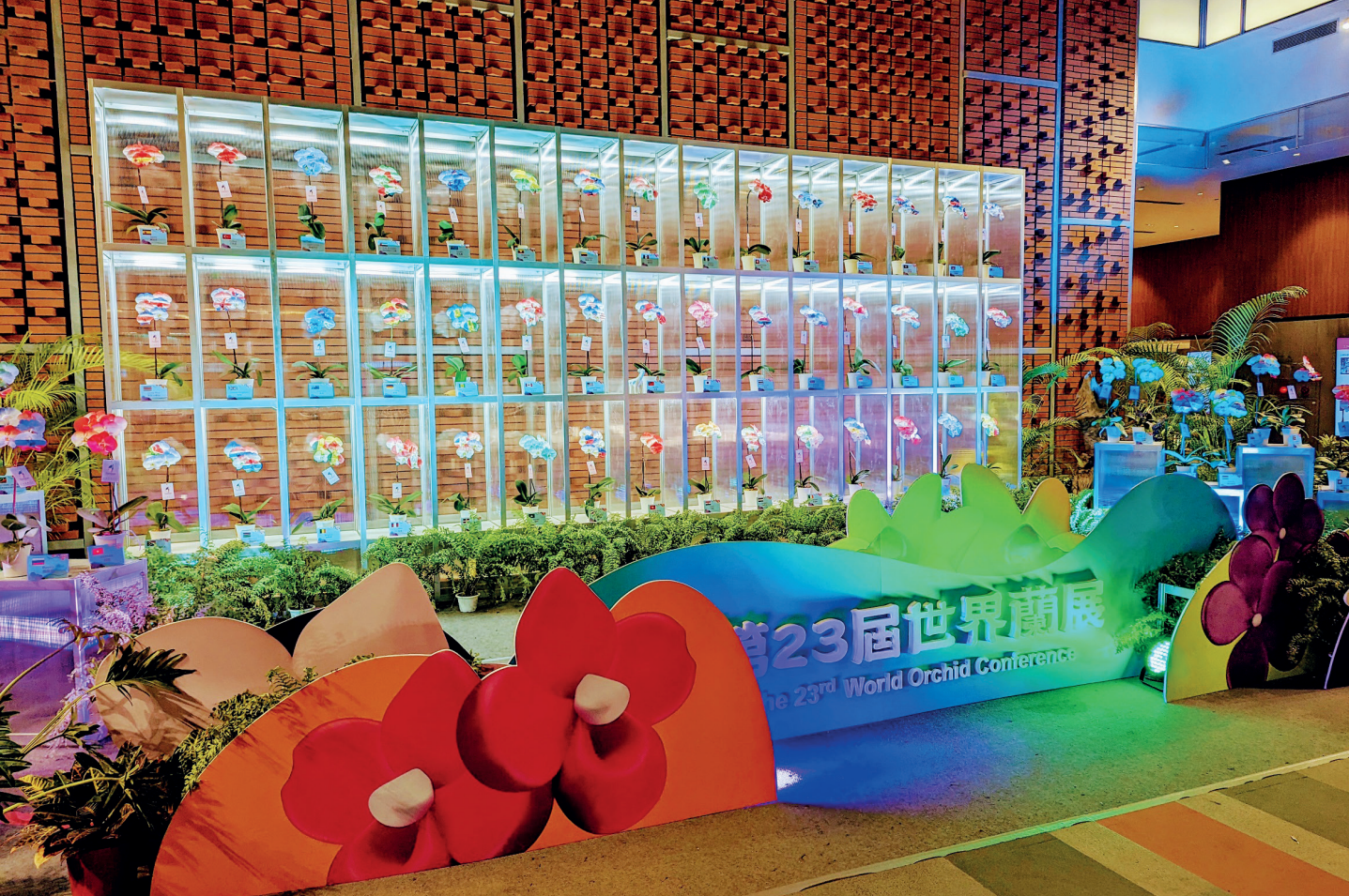
62國國旗噴染蝴蝶蘭除感謝世界各國來臺熱烈參與外，也展現臺灣蘭花文創加值技術。