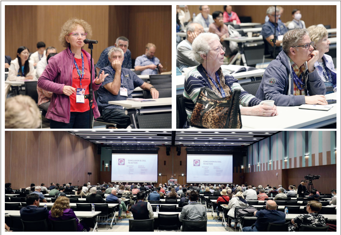
國、內外蘭花專家、學者踴躍參加世界蘭展研討會議及海報展示。

發展協會黃理事長文榮等共同參與。賴副總統致詞時除向國內、外嘉賓表達歡迎及感謝外，並表示臺灣多年以來致力於蘭花保育及種原保存，並且擁有全球最重要的蘭花產業供應鏈，活躍於蘭花的育種、供貨及研發新創，期待這次的活動，不只讓世界欣賞蘭花之美，也能讓世界看見臺灣之美。農業部陳駿季代理部長致詞表示，本活動是臺灣蘭界重要的里程碑，也是大家一同努力的結果。全球每3株蝴蝶蘭就有1株來自臺灣，透過蘭展作為國際