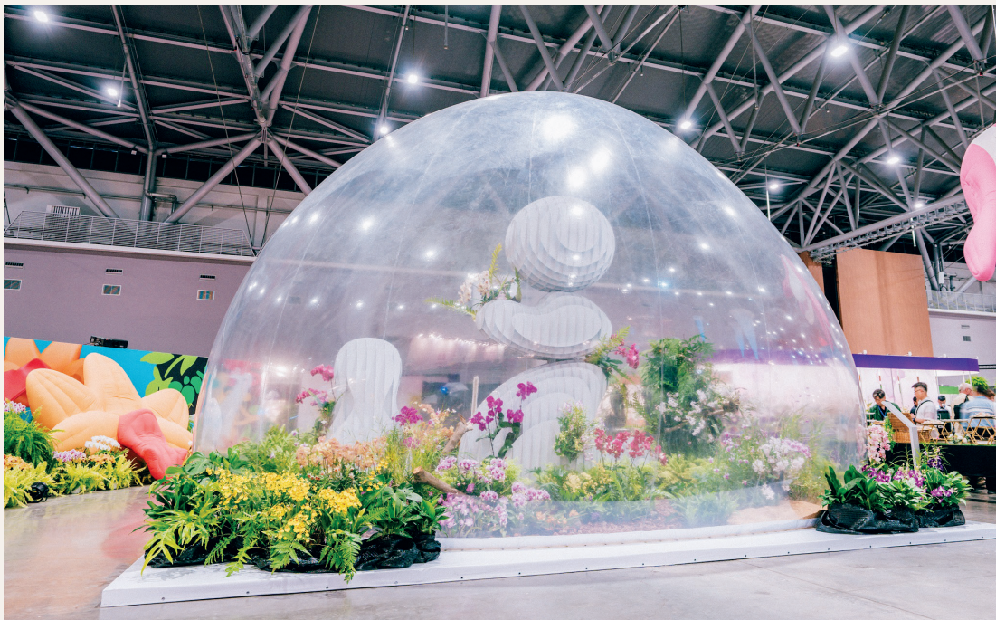
共生站植生充氣裝置藝術，傳達與環境共生共存、生態延續的理念。

(2) 景觀競賽：邀請泰國、新加坡、多明尼加、日本、香港、印尼等9家及國內7家計16家公協會、團體參與蘭花景觀佈置競賽。第一名由泰國Korat Orchid Society × Damrong Star Club 布展之「微笑之國」獲得，布置大氣壯觀，以瀑布花園展現泰國對於朋友、環境的友誼及善意。