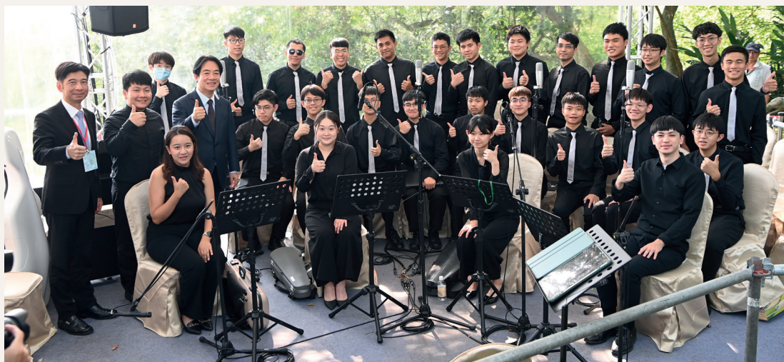
時任副總統賴清德與紀念活動中獻唱之國立臺南第一高級中學合唱團合照。

農田水利署署長蔡昇甫也於致詞時提到，1910年八田與一技師從日本東京帝國大學畢業後，隨即隻身飄洋過海，來到臺灣，參與各項農田水