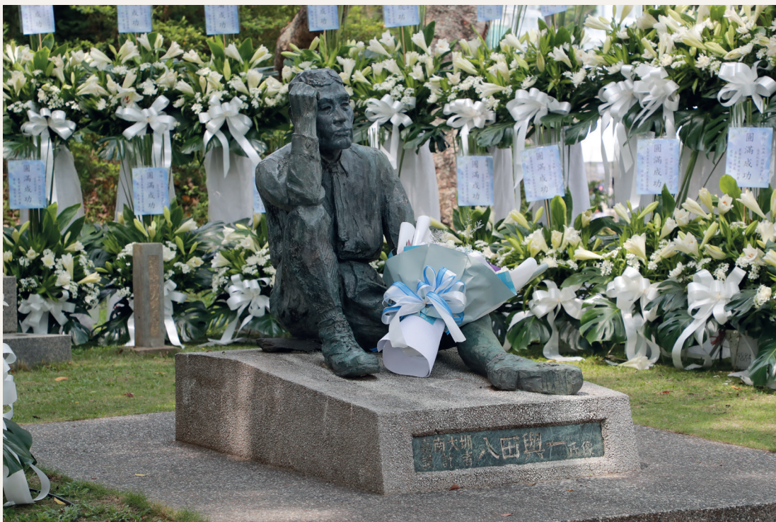
八田與一技師銅像。

八田與一技師與臺日工程師合力打造的嘉南大圳，在工程技術上突破當代瓶頸、在設施功能上把握著最佳效能，且能捲起衣袖與工作同仁一起奮鬥更難能可貴。農田水利署的同仁們將承襲著這樣的理念，用最新的科技、最好的技術、最妥適的管理維護，讓已完工近百年的嘉南大圳能夠持續滋潤廣大的嘉南平原。農田水利署未來將持續強化臺灣的農業水資源韌性，讓圳水長流、農民豐收、農業永續。