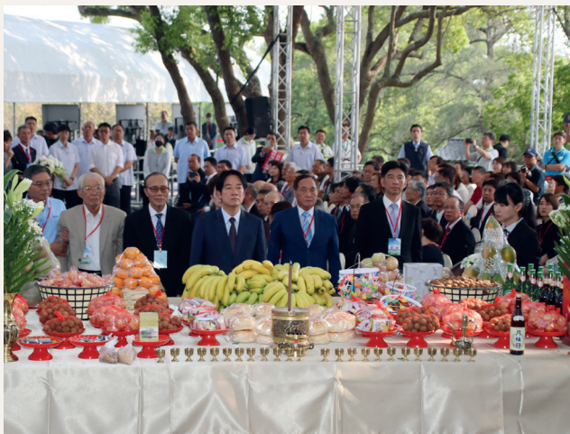
時任副總統賴清德進行公祭。