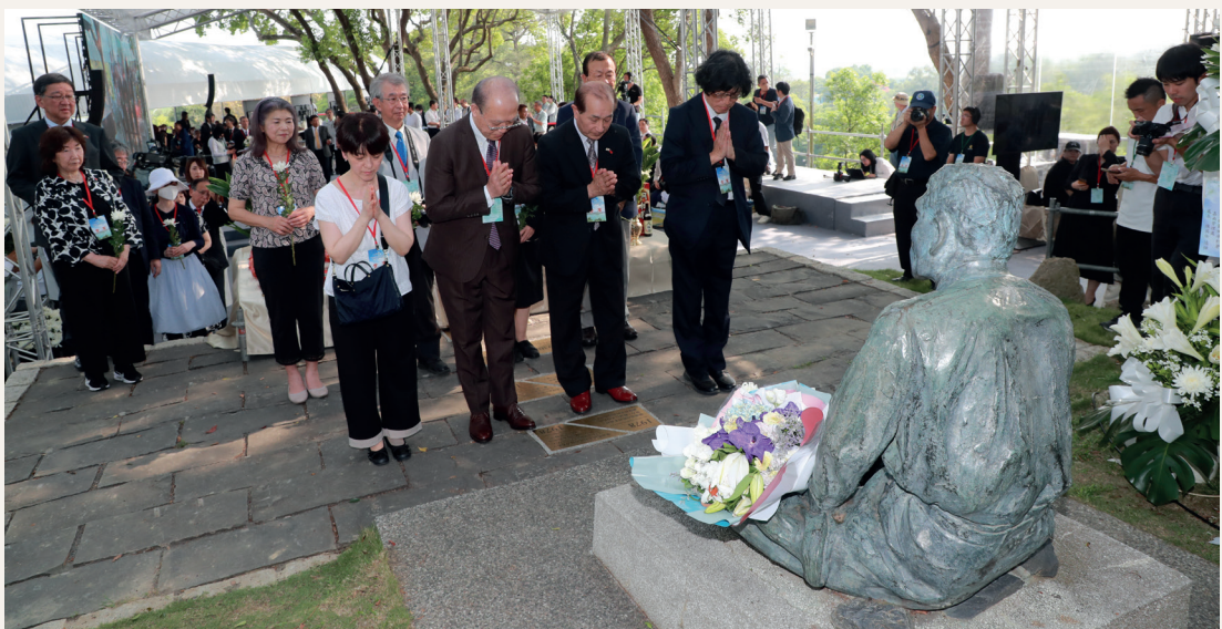
八田與一技師遺族八田修一賢伉儷等人進行家祭。

追思紀念會當日安排家祭、公祭，表達慎終追遠與知恩感恩的敬意，亦播放八田技師於臺灣建設的介