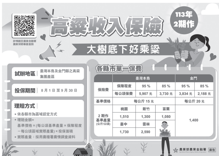
高粱收入保險簡介DM。