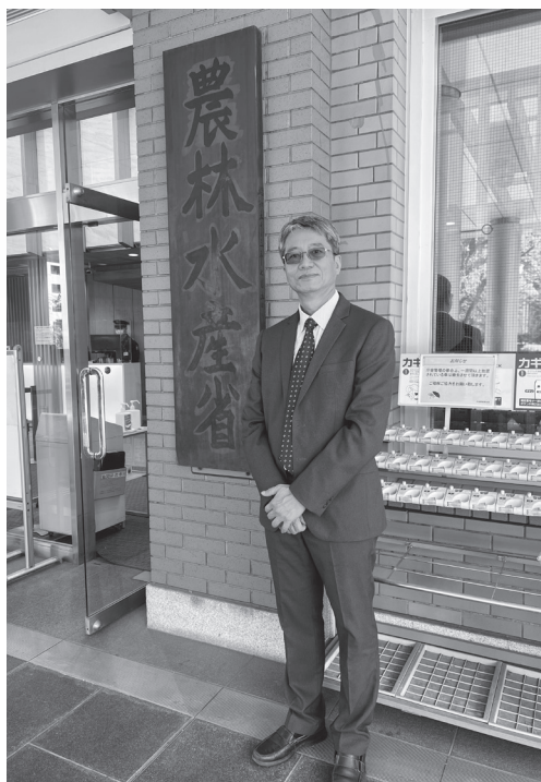
筆者前往日本農林水產省考察。

式，係依保險對象及農場規模而定，對於稻米、小麥、大麥等主要作物即採強制保險，但若農場規模未達最低面積者則採自願保險；而牲畜、果樹、牧草、桑蠶及溫室等均採自願保險方式。