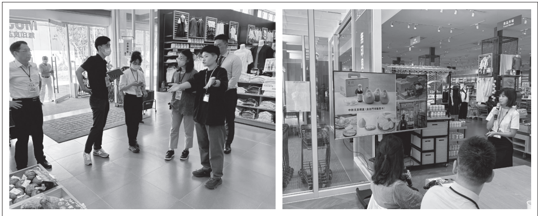
日本笠間市代表現地參訪產銷履歷據點。

銷合作社及無印良品岡山門市。透過參訪行程介紹產銷履歷由生產、分裝及流通至加工等不同階段之驗證農產品，讓日方代表更認識我國產銷履歷農產品從農場到餐桌之安全、安心供應鏈模式，建立在此嚴謹的食品安全基礎上，有助於深化雙方農產品貿易交流合作。