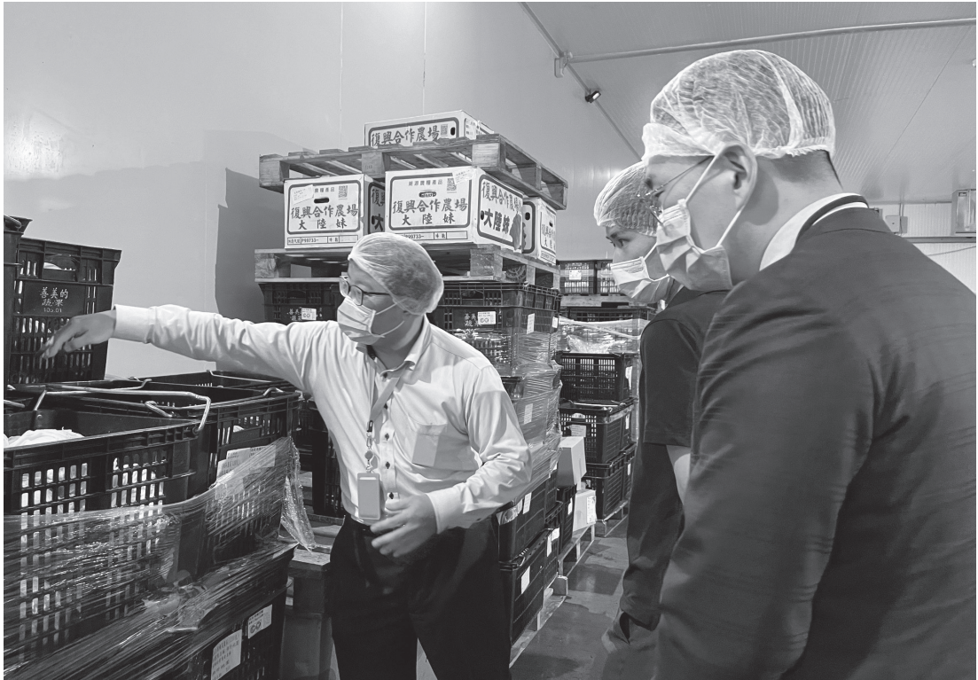
農產品經營者代表向笠間市代表說明產品批次管理作業流程。

國內農業各界也積極爭取食材供應，惟東京奧運組織委員會公布之食材供應標準確實門檻相當高，並非日本國內所有爭取食材供應者均能符合規定並順利供應。因此，日方代表肯定我國能以非活動主辦國之農產品產銷履歷驗證標準，取得該次奧運選手村食材供應資格實屬不易。