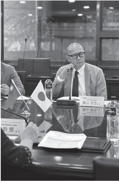
日本笠間市代表拜會農糧署農糧署。

之農業考察，由農糧署接待並規劃系列參訪活動。本次日方派員來臺考察主要是重視消費者關心的食品安全問題，除拜會農糧署外，並瞭解我國產銷履歷驗證制度推動歷程、各項法規制度建立、產業主管機關輔導措施及農產品經營者參與情況等。