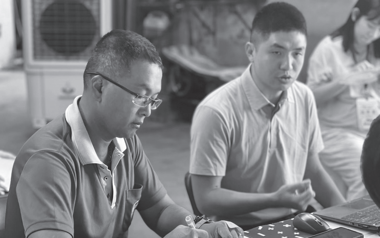
日本笠間市代表參與產銷履歷現地輔導。