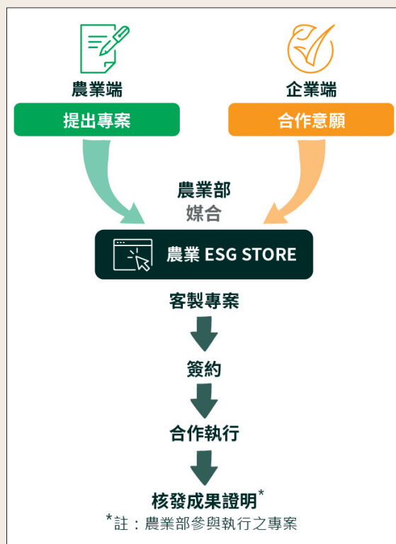
農業永續 ESG 客製媒合平臺企業參與機制。