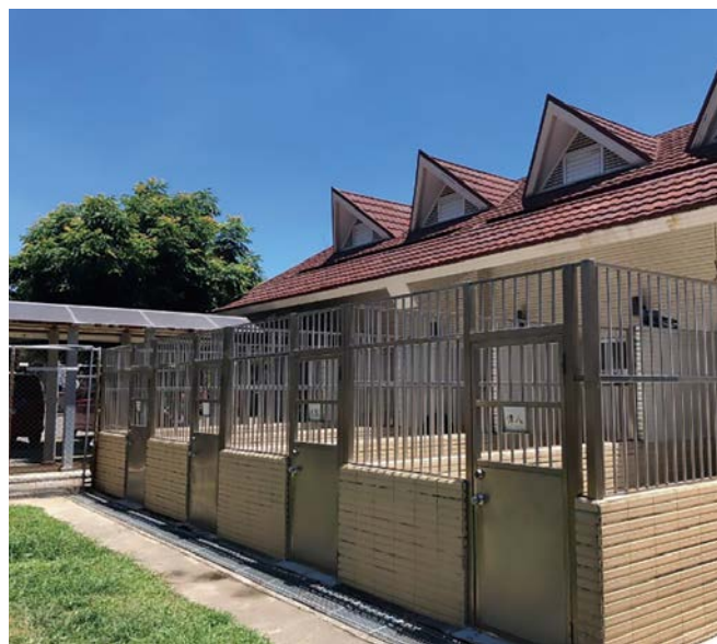
高雄市政府消防局執勤犬舍。

鑑於政府部門執勤犬的管理需要各權責單位的配合，權責單位應定期檢視其建立的飼養管理、照護醫療、訓練、派勤、送養及其他有關執勤犬之作業基準，並加以落實。在規劃成立執勤犬隊時，除了勤務考量外，亦應納入犬隻動物福利。農業部也將持續推動執勤犬動物福利相關教育訓練課程，至各權責單位辦理政府部門執勤犬進行訪視交流，適時檢討修正相關規定，以保障動物福利。期透過這些機制，能讓政府部門在運用或訓練執勤犬時，能兼顧犬隻安全、健康及生活品質，維護犬隻之動物福利，同時提高工作效率，創造出雙贏的局面。🐾