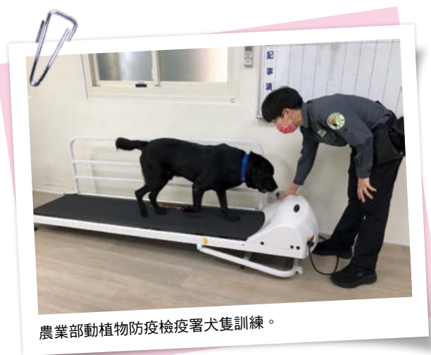
農業部動植物防疫檢疫署犬隻訓練。

依本規則政府部門於運用執勤犬之執勤工時，每星期不超過40小時，每次不得連續執勤超過4小時，執勤期間應提供適當休息，另基於動物健康情形與動物福利考量，本規則訂定執勤犬之服務年限為4年，政府部門得視其健康情