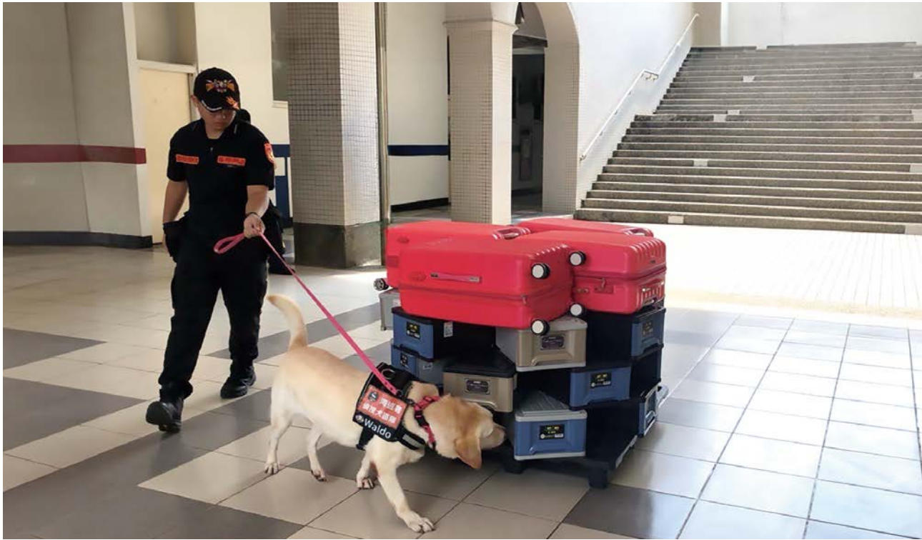
海洋委員會海巡署偵搜犬訓練情形。

單位運用犬隻時，除了須加強種犬基因篩選外，亦須及早了解犬隻習性和行為上的表現，並調整其管理和照顧模式，例如拉不拉多犬多有喜咬布的習性，故考量可否於欄舍內放堅固布墊或玩具。為降低其行為異常發生的機率，宜多放風等。