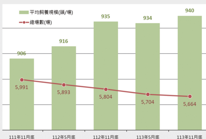
圖1. 養豬飼養場數與平均飼養規模

少11.2萬頭。就飼養規模別結構觀之，飼養1~199頭1,748場（占30.9%），較前次調查減少39場，主係農戶年邁或環保法規等因素所致，而其飼養頭數僅占總在養量2.2%；另飼養1,000頭以上大規模場數為1,522場（占26.9%），較前次調查減少6場，其飼養頭數占總在養量72.0%，養豬場平均每場飼養規模增至940頭，產業持續朝規模經濟方向發展。（前述分析內容詳見表1、圖1所示）