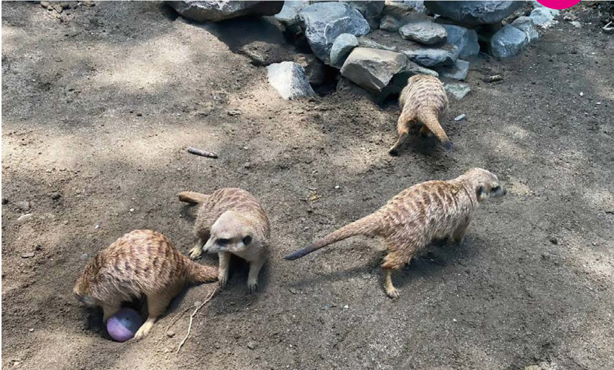
群居狐獴進行挖掘行為及尋找藏食玩具。

攀爬架或平臺，讓動物的活動範圍不僅侷限於地面。日常的給食除了由工作人員或遊客直接給予互動餵食外，可利用環境內空間進行藏食、使用自製或市售漏食玩具、以草架或是將草料懸吊不直接放置於飼料槽等，儘可能增加動物在尋找食物及攝食所需花費的時間，最重要的是，應針對環境豐富化措施及動物反應定期進行記錄，確保給予的豐富化設施是有效的，並對執行內容持續滾動式檢討更新。