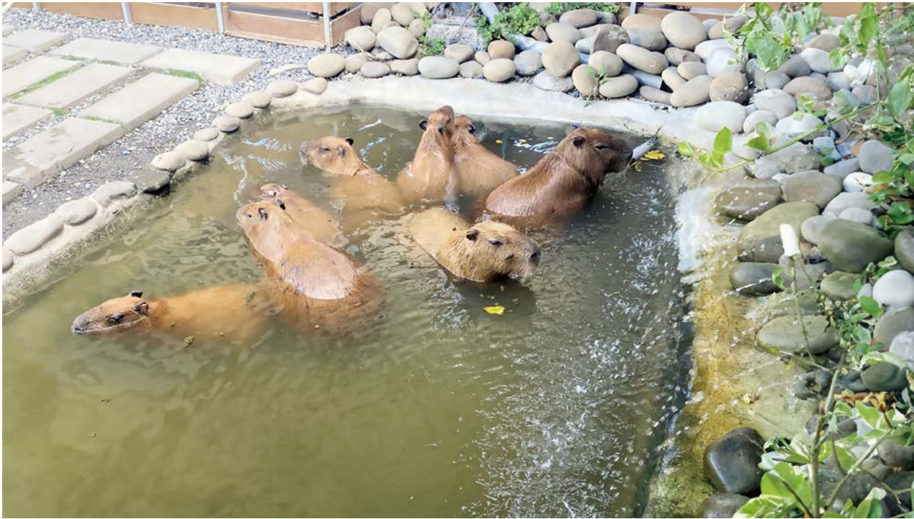
屬半水生動物的水豚群浸泡於水池情形。

阻隔物，例如使用植物造景或圍欄讓動物感受到壓力時有迴避遊客的自由，提供動物更充足選擇權，並應注意每頭動物的行為，適度調整動物展演的時間與方式，以減輕動物的壓力。