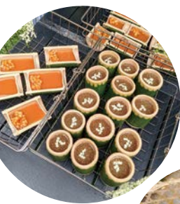
酒保坪農場產地 餐桌特色餐點。