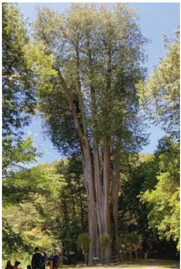
雪山神木位於大雪山林道50公里下方山谷中，樹種為紅檜，樹高達50公尺，高聳挺拔枝葉蒼翠。

為辦理社區資源整合與培力，生態旅遊協會邀請周邊社區夥伴共同參與，投入生態旅遊軸帶推動，於2023至2024年間共召開15次共識會及數次工作會議，溝通建立大雪山生態旅遊軸帶遊程發展之重要共識，並滾動式調整遊程操作細節與合作模式。另為精進社區導覽解說員實際帶領與應對遊客的專業職能，計畫推動期間，辦理達116小時的增能培力課程。