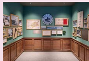
大雪山林業歷史區