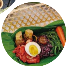
大雪山的禮物-森林 療癒便當。