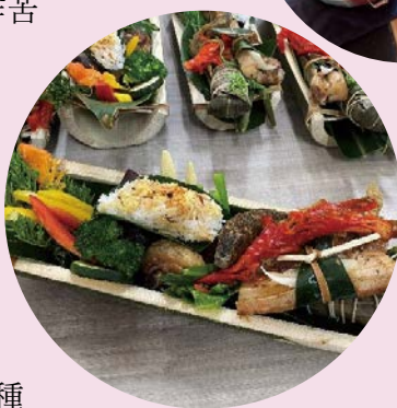
布農創意料理套餐需事先預約。