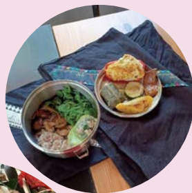
搭配生態旅遊遊程的獵人便當。

丹大布農生態旅遊採用「社區共管」模式，由部落自主規劃旅遊路線與承載量，確保不過度開發，收益則部分回饋部落建設與生態保育基金，形成良性循環。遊客在此不僅是觀光，更能深度參與布農族生活，學習如何與自然和諧共處。這種結合生態保育、文化傳承與山村經濟發展、地方創生的模式，正是當代里山精神的最佳實踐。