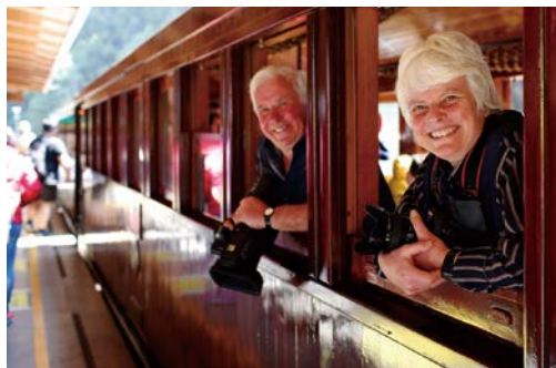
檜木車廂內陽光灑落，旅人探頭，用笑容與相機記錄旅途的一縷光影。

隨著森林保育意識興起，1991年起全面禁伐天然林，林業軌道失去了原本的經濟功能，多數被迫停止營運，有些