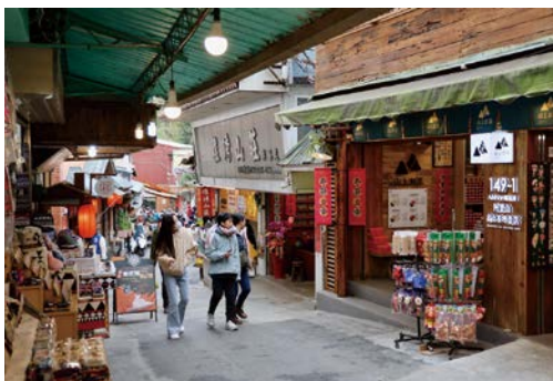
當居民成為林業軌道旅程的主人，鐵道便不再只是觀光動線，而是梳理社區再生、文化認同與生活韻味的溫暖脈絡。