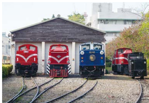
車庫前，不同年代、不同造型的機關車並肩而立，訴說著各自與山林相遇的故事。

書。在旅途中設置生態展示、互動導覽，加入山林共管、自然保育、水土保持、軌道機械等議題的解說，豐富旅客見聞內涵，於旅程沿線，輕鬆自然的展現人與山林互動的各項篇章。