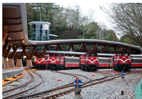
上圖：神木站旁，溪水輕流淌，苔蘚滿石牆，生態工法讓人與自然更溫柔的共處。