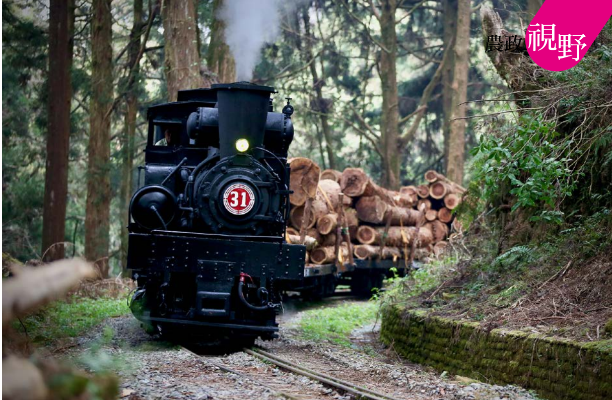
Shay 31蒸汽機車冒著蒸汽緩緩前行，載著沉甸甸的原木與記憶。在蒸汽與木香交織的空氣中，遙想林業興盛的過往。

甚至難逃拆除的命運。然而，林業軌道並未因此沉寂，透過政府單位、民間團體與沿線社區的努力，它們轉型重生，成為山林的時光走廊，森林療癒之旅的起點。