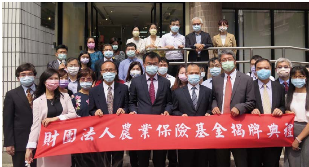
農業部、農金署長官與農險基金董事、監察人及同仁合影。

本辦法規範重點包括：保險人及農險基金危險承擔之比率與例外情形及適用原則、農險基金擬定危險分散機制方案報送主管機關備查、共保組織成員與認受成分之會商訂定、共保組織停止業務等之處置、費率與附加費用率用途及本辦法施行前已銷售保單相關規定之適用等。