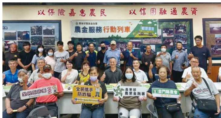
金門縣農金服務行動列車。

114年7、8月間丹娜絲颱風等來襲，造成南部地區嚴重災損，行政院陸續公告臺南市、嘉義縣（市）、高雄市新興區及雲林縣為丹娜絲颱風風災災