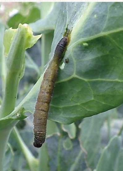
受病毒感染的幼蟲爬到高處死亡。

臺灣於 2021 年在青蔥甜菜夜蛾幼蟲體內分離出核多角體病毒（NPV）株 BV001，但病毒大量生產需先在夜蛾幼蟲體內繁殖，研磨感染幼蟲提取病毒，或冷凍保存幼蟲，生產成本高，而且傳統病毒製劑需低溫保存，不利於商品化，限制了大規模應用。近期，科學家克服了製劑的挑戰，研發出水分散性顆粒製劑，在室溫下可穩定保存超過9個月，大幅提升使用便利性。此外，結合人工智慧的自動化生產系統也已經投入應用，利用影像辨識和機械手臂自動完成昆蟲飼養、病毒感染、疾病監測、病毒提取與保存，顯著降低人力成本，提高生產效率。